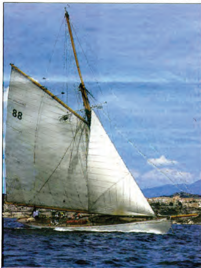
Dernière étape aujourd'hui pour l'ensemble des concurrents.

MAXIME BLANCHARD mblanchard@nicematin.fr