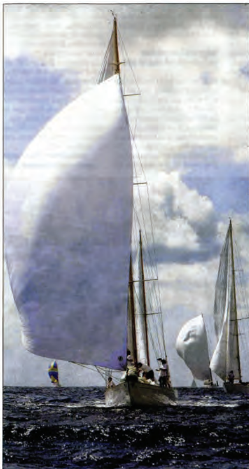
Hier, 22 navires sont partis d'Ajaccio vers le Valinco.

Pour sa quatrième édition, la compétition est un réel succès, d'autant qu'elle rameute les noms de la « grande famille » du yachting international.