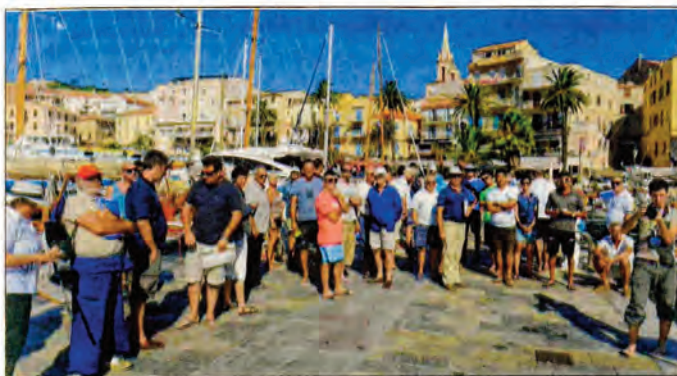
21 équipages sont présents cette année pour la Corsica Classic.