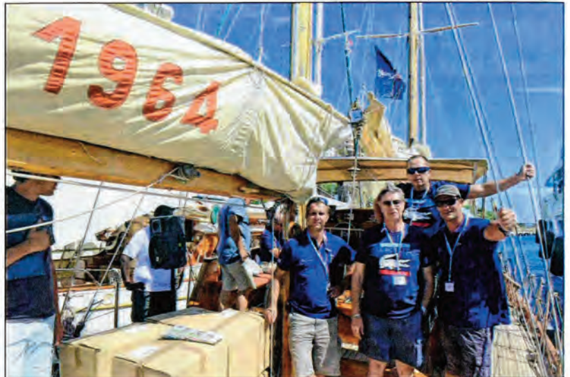
Les équipages s'apprêtent à larguer les amarres.