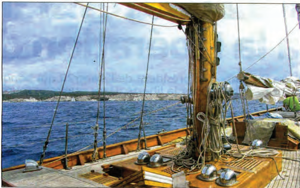
L'Aitor, tour à tour cuisine, dortoir, nursery... bateau à tout faire de la Corsica Classic et ange gardien pour les concurrents de la course.