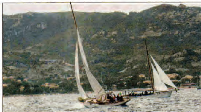
La 1 re étape annulée, quelques navires ont offert un magnifique spectacle aux visiteurs.

Cela aurait dû être le premier départ de la quatrième course de la Corsica Classic. Mais hier, à cause d'une météo marine défavorable, les organisateurs n'ont pas voulu mettre en danger les « vieilles dames » de la mer. À la place, quelques-uns des beaux bâtiments prêts à partir pour la course ont décidé de donner un show sur les flots, dans la baie de Calvi, pour le plaisir des yeux des visiteurs. Ainsi, lundi après-midi, l' Aitor (le navire de l'organisation mesurant 24 m), le Vistona (17 m) et le Lys (17 m) notamment, ont navigué sur les flots quelque peu agités, au moteur et à la petite voile.