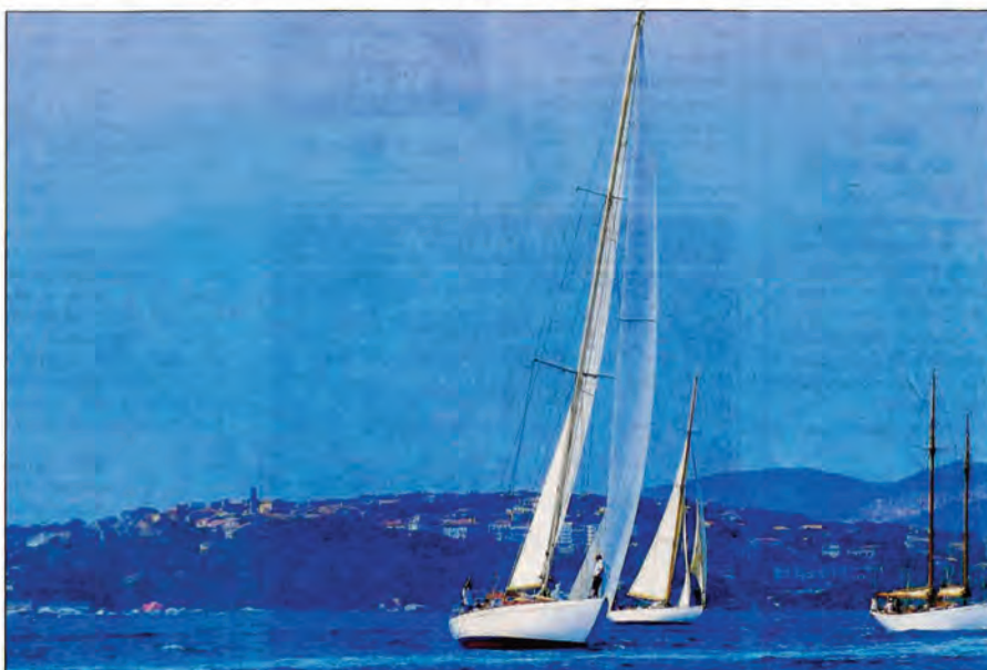
Avant dernière étape hier depuis Porto-Vecchio en direction de Bonifacio qui accueille l'ultime parcours avant la remise des prix ce soir à 19 heures à bord du Belem .

La météo était donc magnifique avec seulement quelques nuages essaïmant ici et là pour parfaire l'esthétique de l'environnement spectaculaire du golfe de la cité du sel. Une brise de bon aloi permettait d'effectuer quelques bords mettant en valeur la qualité et la beauté des fières embarcations. Le ballet naval était parfait... La course de samedi, l'avant dernière, reproduisait celle de la veille mais en sens inverse soit Porto-Vecchio/Bonifacio afin d'aborder « la soirée des partenaires » (dans le port de Bonifacio) dès le début de soirée.