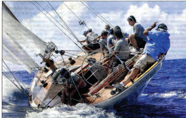
C'est le puissant Eileen, un class America de 1938 qui a remporté l'épreuve en début d'après-midi.