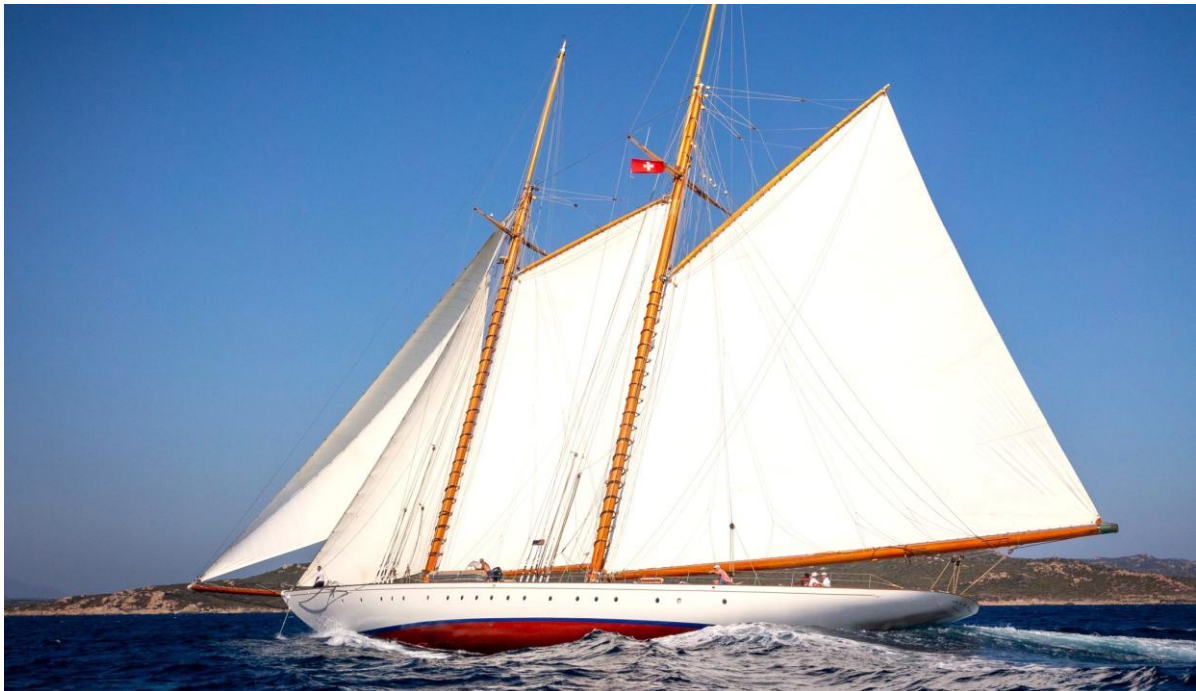
Corsica Classic 2023 Bon ifacio SY Elena of London