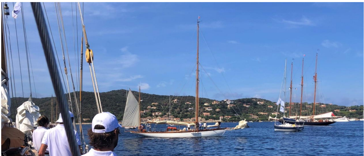
Corsica Classic 2022 Campomoro