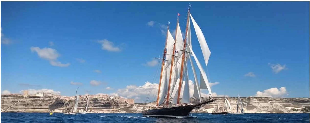
Corsica Classic 2022 Bonifacio – Saint Cyrien SY Shenandoah of Sark

Le bénéfice de toucher à quai, durant 7 jours, dans 6 ports et mouillages différents, un grand public curieux et disponible.