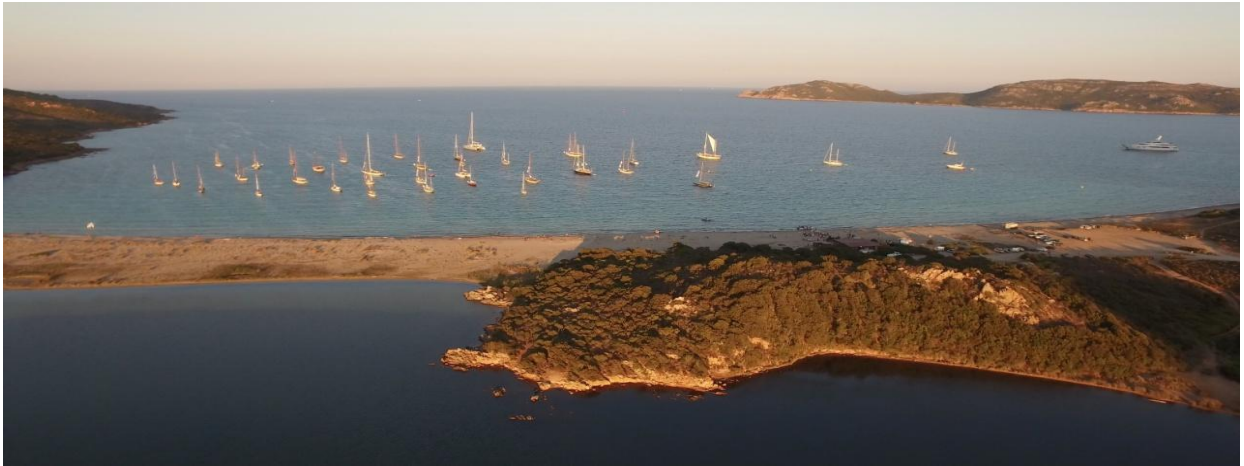
Corsica Classic 2017 Bonifacio plage de Balistra

Faire vivre un événement green, inoubliable à vos clients privilégiés, dirigeants, collaborateurs ou invités médias durant une semaine, ponctué d'animations et de happenings lifestyle sur toutes les étapes dans une ambiance conviviale et un cadre de rêve.