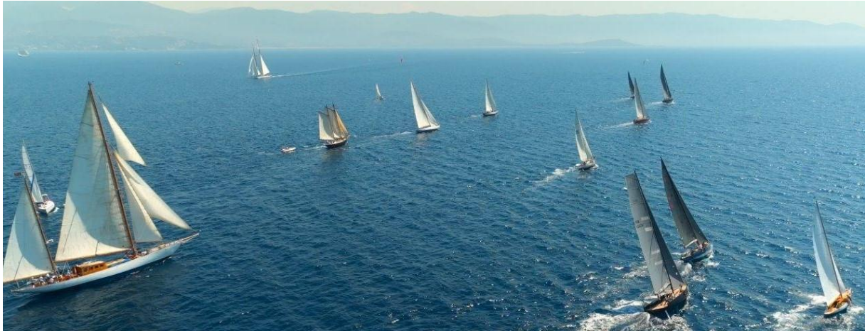
Corsica Classic 2023 Ajaccio – Propriano ligne de départ