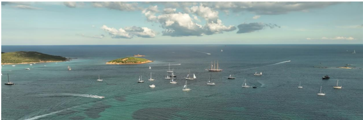
Corsica Classic 2022 Saint-Cyprien