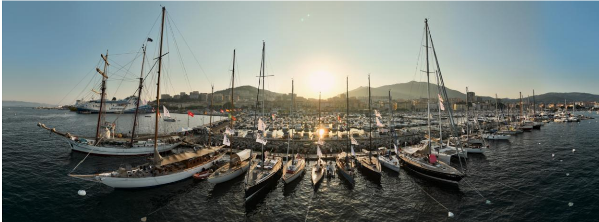
Corsica Classic 2023 Ajaccio Port Charles Ornano