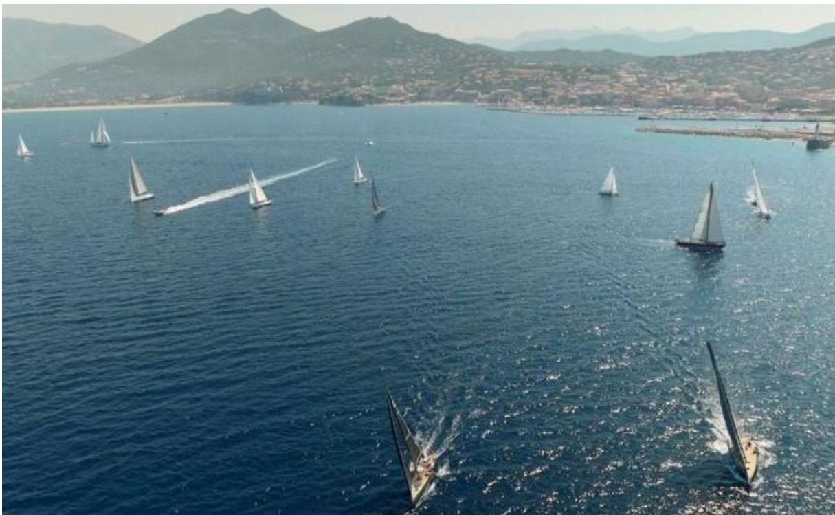
Corsica Classic 2023 Propriano ligne de départ