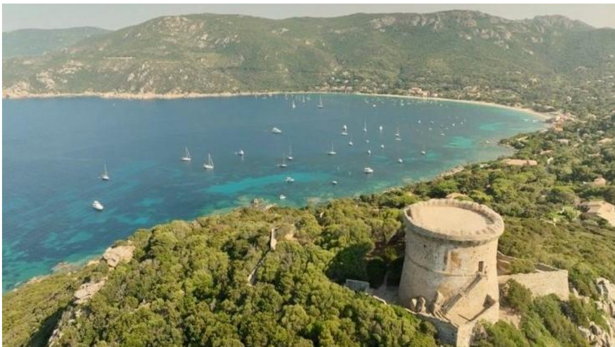
Corsica Classic 2023 Campomoro