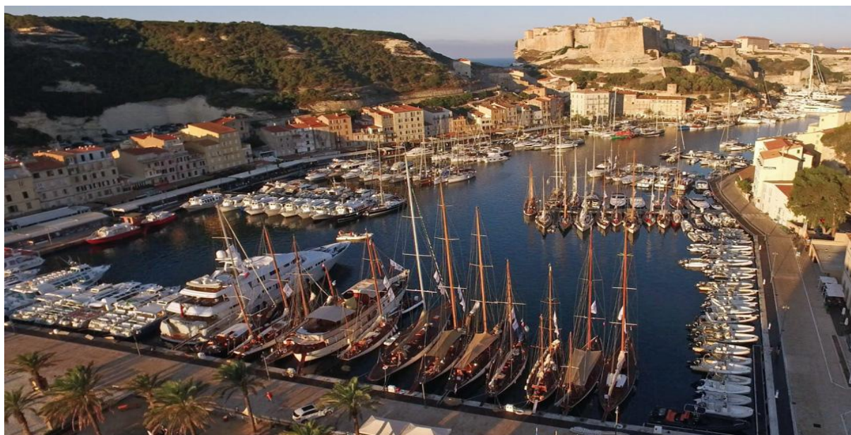
Corsica Classic 2018 Bonifacio

Le Pack partenaire Or vous offre une exposition optimale & un événement dédié à votre marque