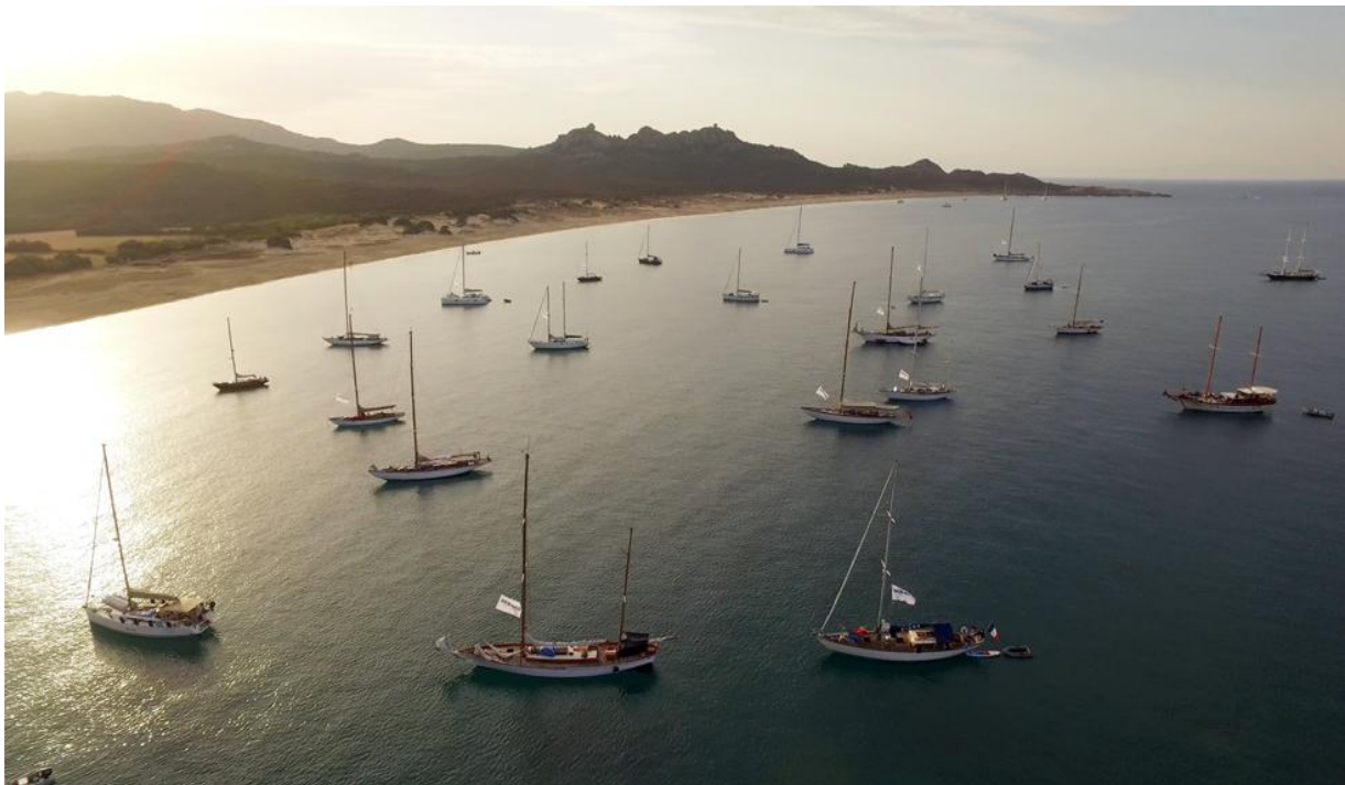
Corsica Classic 2017 Plage d'Erbaju Domaine de Murtoli

Des prestations personnalisées peuvent être mises à votre disposition.