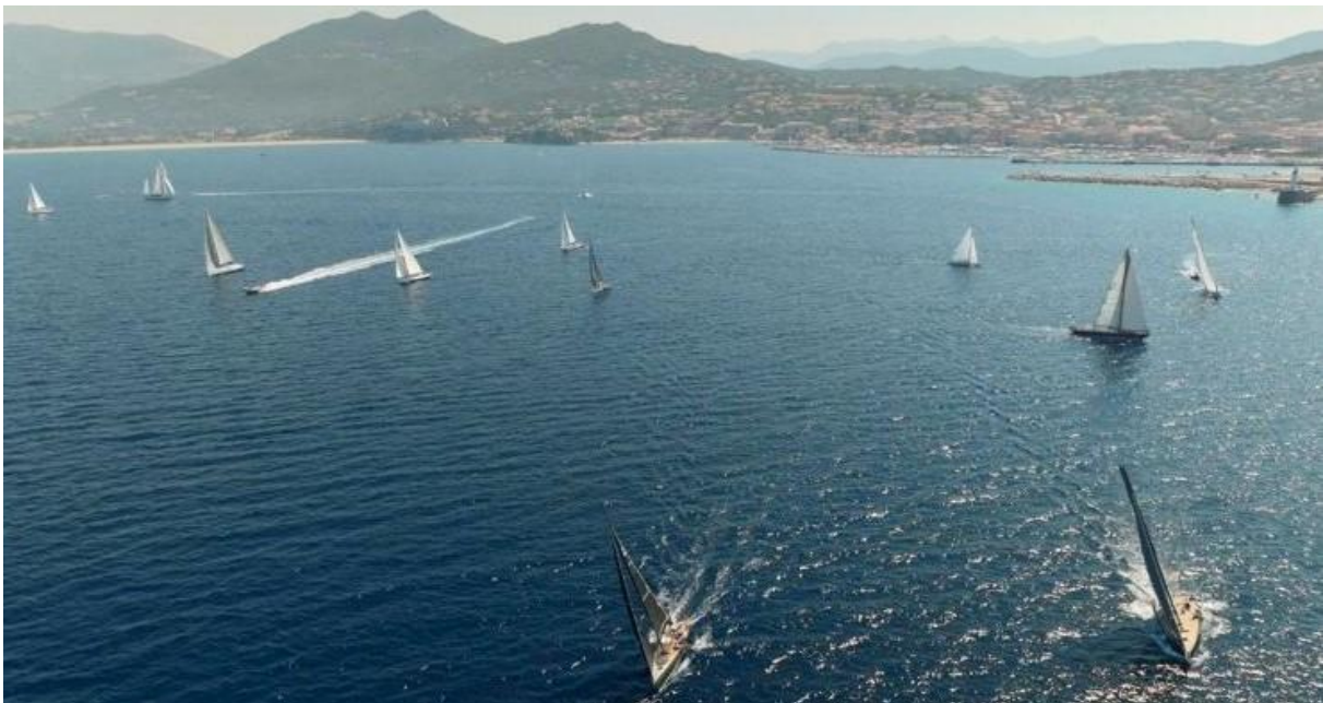
Corsica Classic 2023 départ Propriano - Campomoro