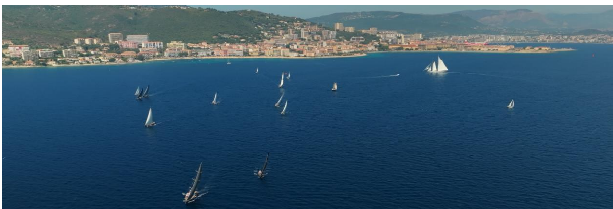
Corsica Classic 2023 Ajaccio - Propriano