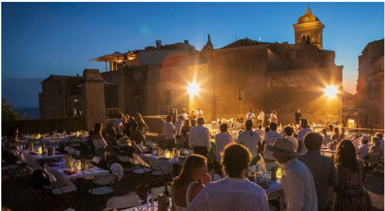
Corsica Classic 2022 Bonifacio diner du Bastion de l'Etendard