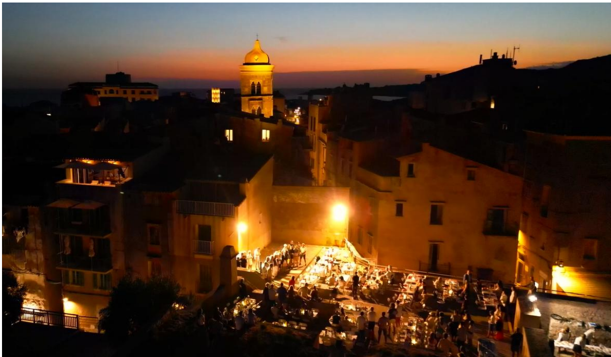
Corsica Classic 2023 Bonifacio Bastion de l'Etendard diner de remise des prix