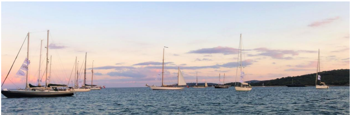
Corsica Classic 2022 Saint-Cyprien