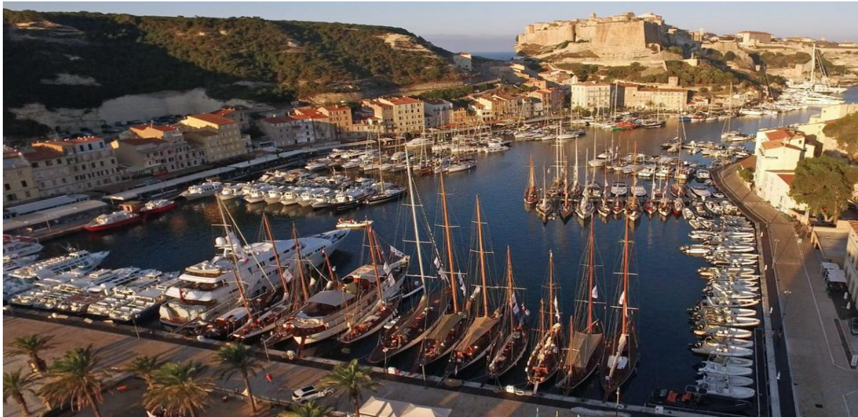
Port de Bonifacio photo Corsica Classic 2018 © JP Pyrée

La Corsica Classic est ouverte à tous les yachts de tradition jaugés CIM 2024, les "Esprits de tradition", modernes jaugés IRC 2024 et Osiris. Affiliée à la Fédération française de voile (FFV), la course s'inscrit dans le circuit officiel organisé par le Comité International de Méditerranée (CIM) et l'Association Française des Yachts de Tradition (AFYT).