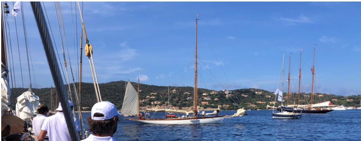
Corsica Classic 2022 Campomoro