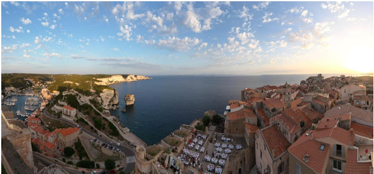
Corsica Classic © 2022 Bonifacio diner du Bastion de l'Etendard

www.gloriamarisgroupe.com // @gloriamarisgroupe