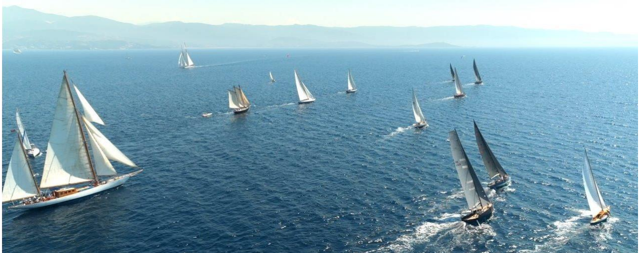
Corsica Classic 2023 ligne de départ Ajaccio - Propriano

Le casting 2024 de la Corsica Classic annonce un très haut niveau de régatiers et promet un spectacle d'anthologie.