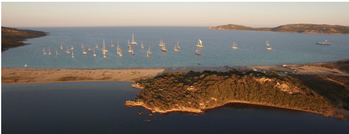
Bonifacio Golfe de Sant' Amanza CC 2017 © photo Emmanuel Kirch by drone pilot Nicolas di Stefano

Une course de voilier classique et moderne, un évènement incontournable et une aventure lifestyle unique autour de la Corse.