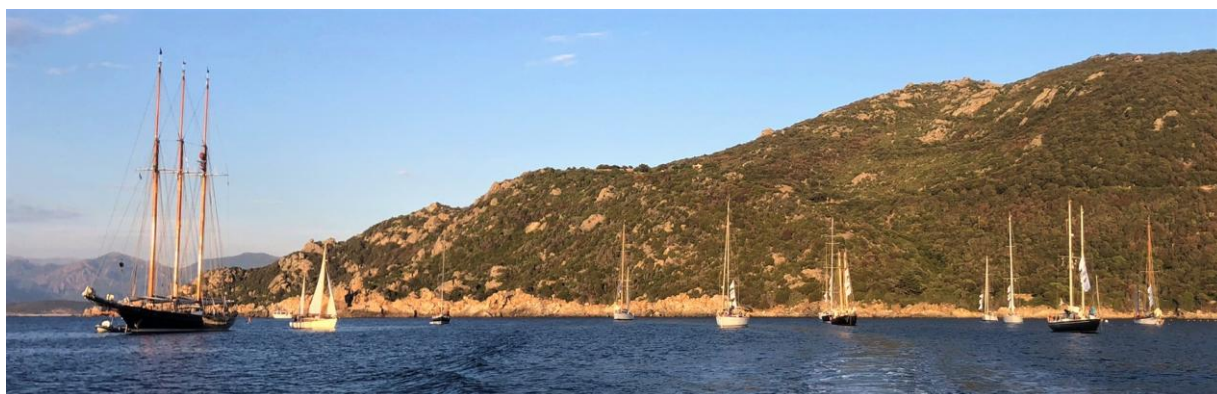
Corsica Classic 2022 Campomoro