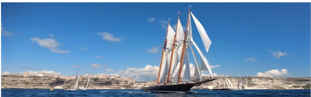
Corsica Classic 2022 Bonifacio SY Shendoah of Sarks

Plus de 150 yachts, parmi les plus beaux au monde, ont participé à la Corsica Classic depuis sa création 2010. Un casting exceptionnel, renouvelé chaque année, de véritables œuvres d'art flottantes, toujours prêtes à en découdre sur l'eau. Le plus ancien voilier de l'histoire de la régates avait 132 ans - SY Sky, présent en 2022 ! Cette année, le doyen de l'année fête ses 100 ans : SY Emily, un plan Fife 8 MJ construit en 1924 pour les JO de Paris, qui avait remporté la médaille d'argent aux couleurs de la Grande-Bretagne. Le casting sera encore une fois historique, avec près de 20 voiliers d'exception présents.