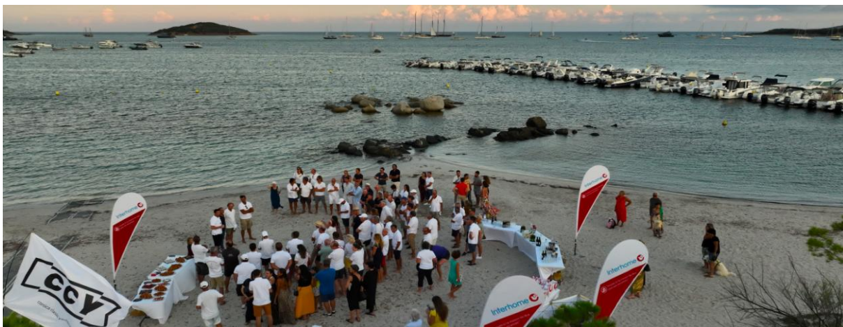
Corsica Classic 2022 cocktail plage de Saint- Cyprien

Les participants de la Corsica Classic prendront le départ d'Ajaccio, au port Charles Ornano, où la flotte sera accueillie pour les inscriptions mercredi 21 août. Le parcours, en 7 étapes, se déroulera sous les auspices de la Corse du Sud au départ d'Ajaccio port Charles Ornano, puis direction la plage de Portigliolo, Propriano, Campomoro, Bonifacio et Saint-Cyprien avant un final en beauté face à la citadelle historique de Bonifacio.