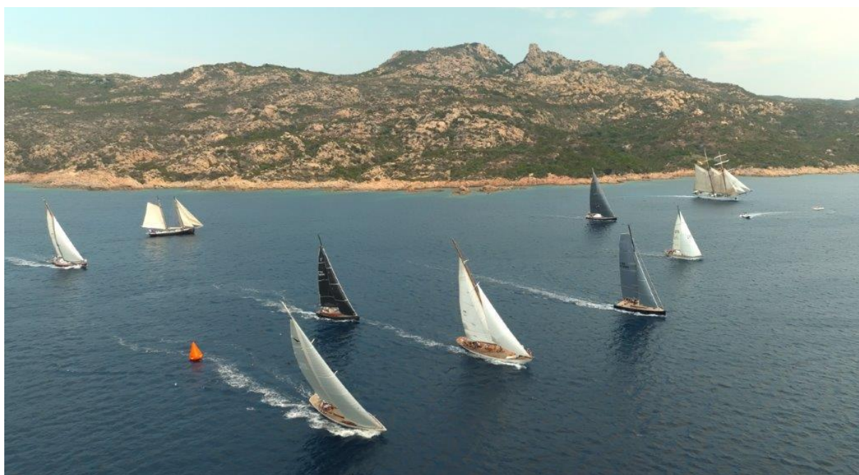
Corsica Classic 2023 Bonifacio ligne de départ Fazio

https://www.corsica-classic.com/forms/INSCRIPTION-2024-Corsica-Classic-du-mercredi-21-Ajaccio-au-jeudi-29-aout-Bonifacio-2024_f7.html