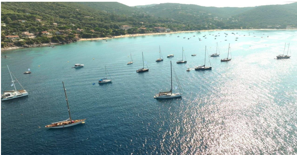
Corsica Classic 2023 Campomoro