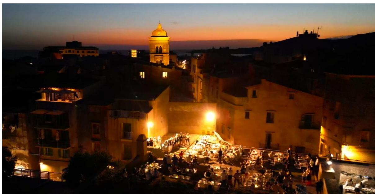
Corsica Classic 2023 Bonifacio Bastion de l'Etendard remise des prix diner