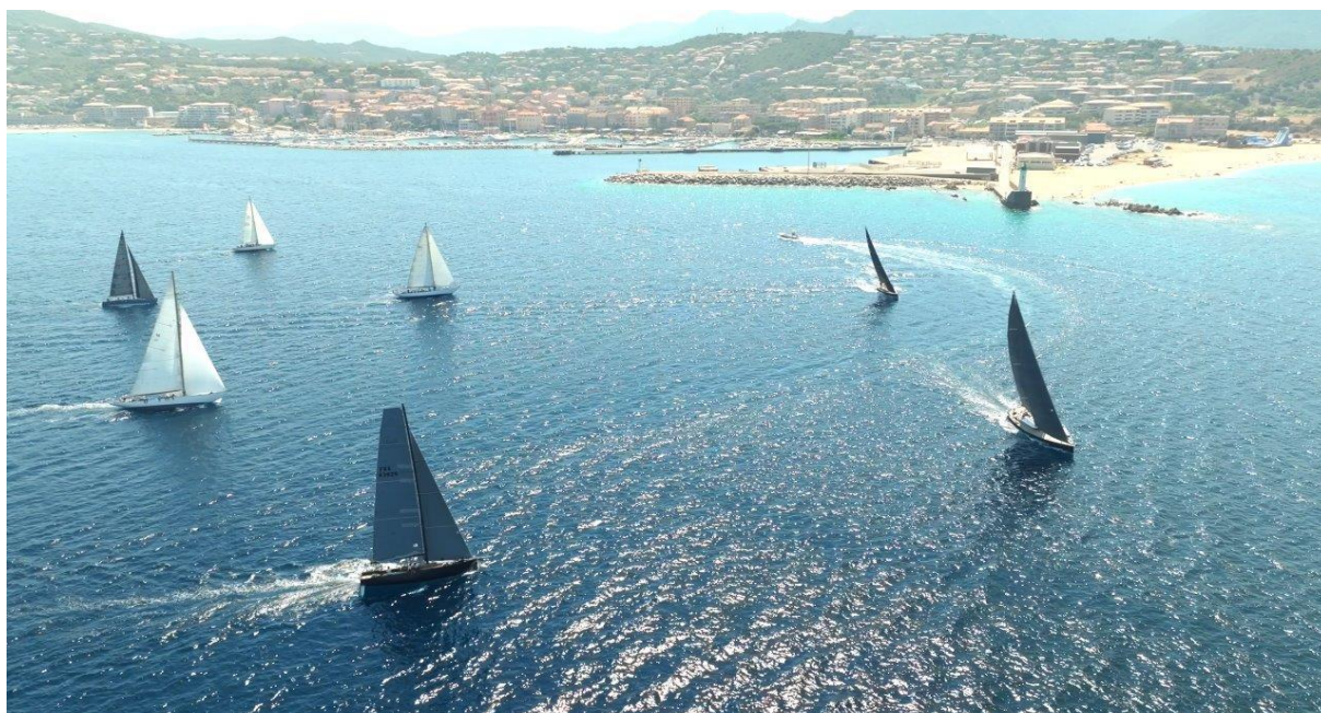
Corsica Classic 2023 ligne de départ Propriano – Campomoro