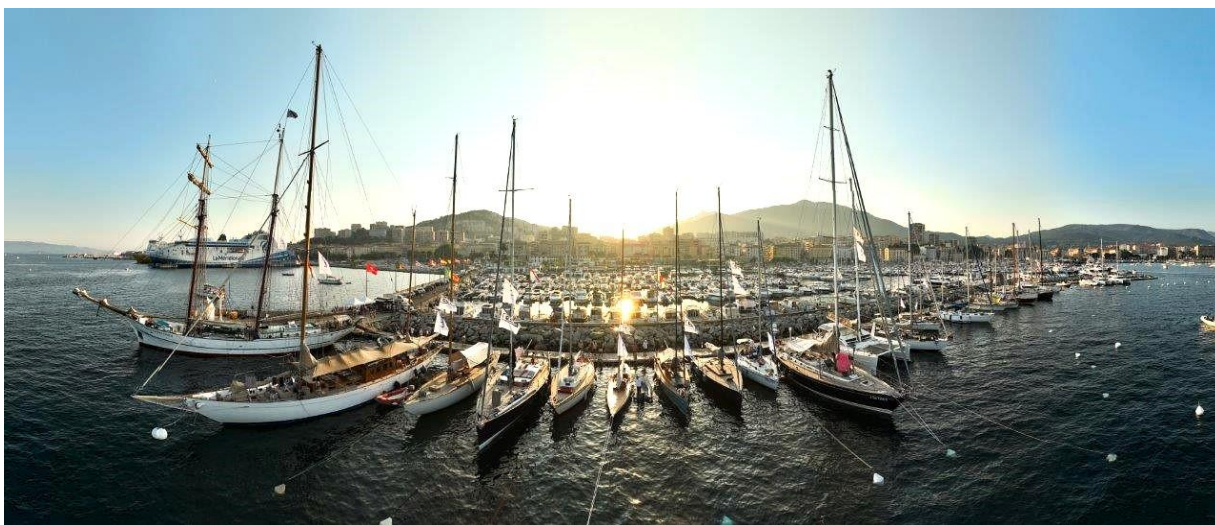
Corsica Classic 2023 Ajaccio Port Charles Ornano