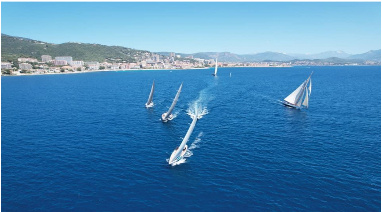
Régates Napoléon 2021 ligne de départ

Le golfe d'Ajaccio, véritable stade nautique : protégé des vents forts, assure une navigation idéale sous une brise de 10 à 20 nœuds.