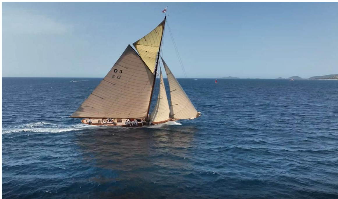
Régates Napoléon 2022 SY Tuiga photo Arnaud Guilbert DR Epoque Aurique