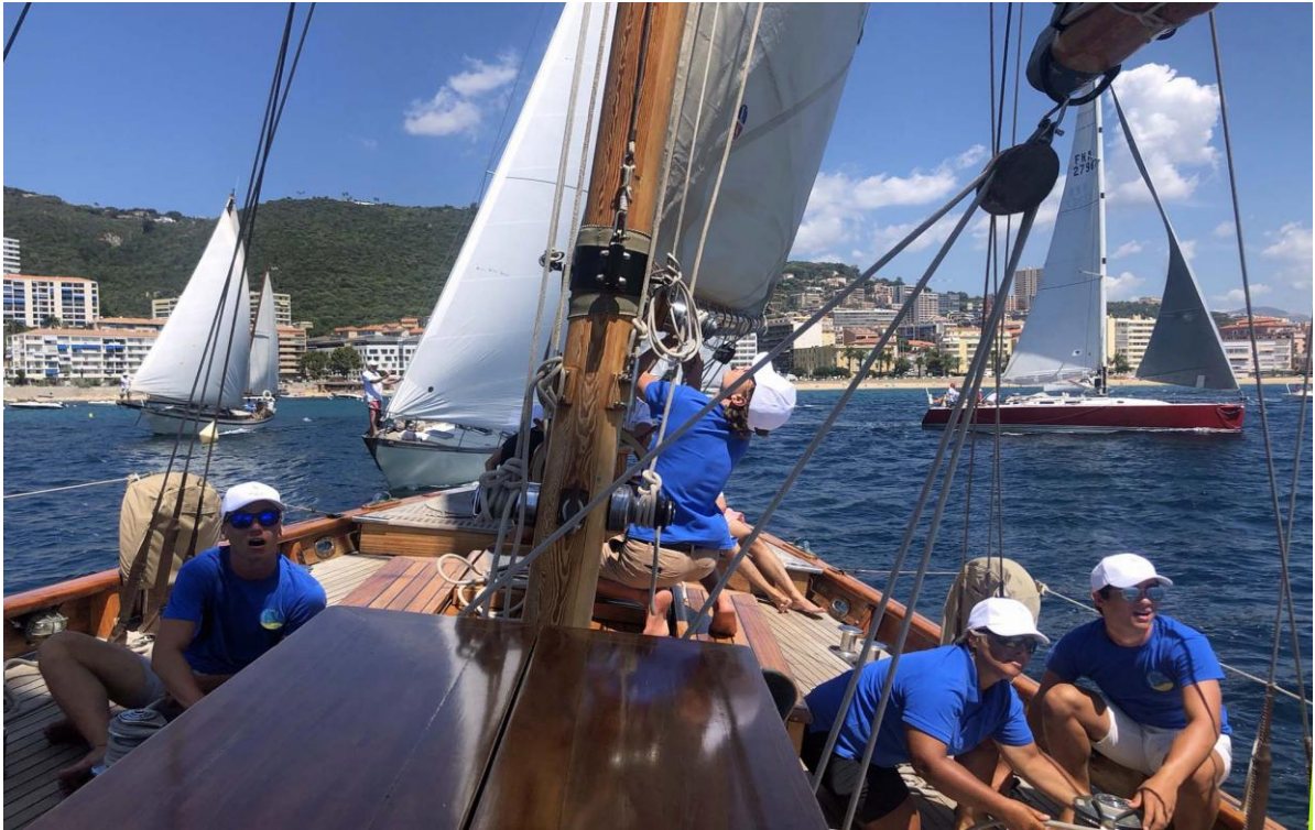
Régates Napoléon 2020 ligne de départ SY Hygie x Squadra Mare e Vela

Corsica Classic Yachting Association : Port Charles Ornano • 20 000 Ajaccio contact@corsica-classic.com www.corsica-classic.com