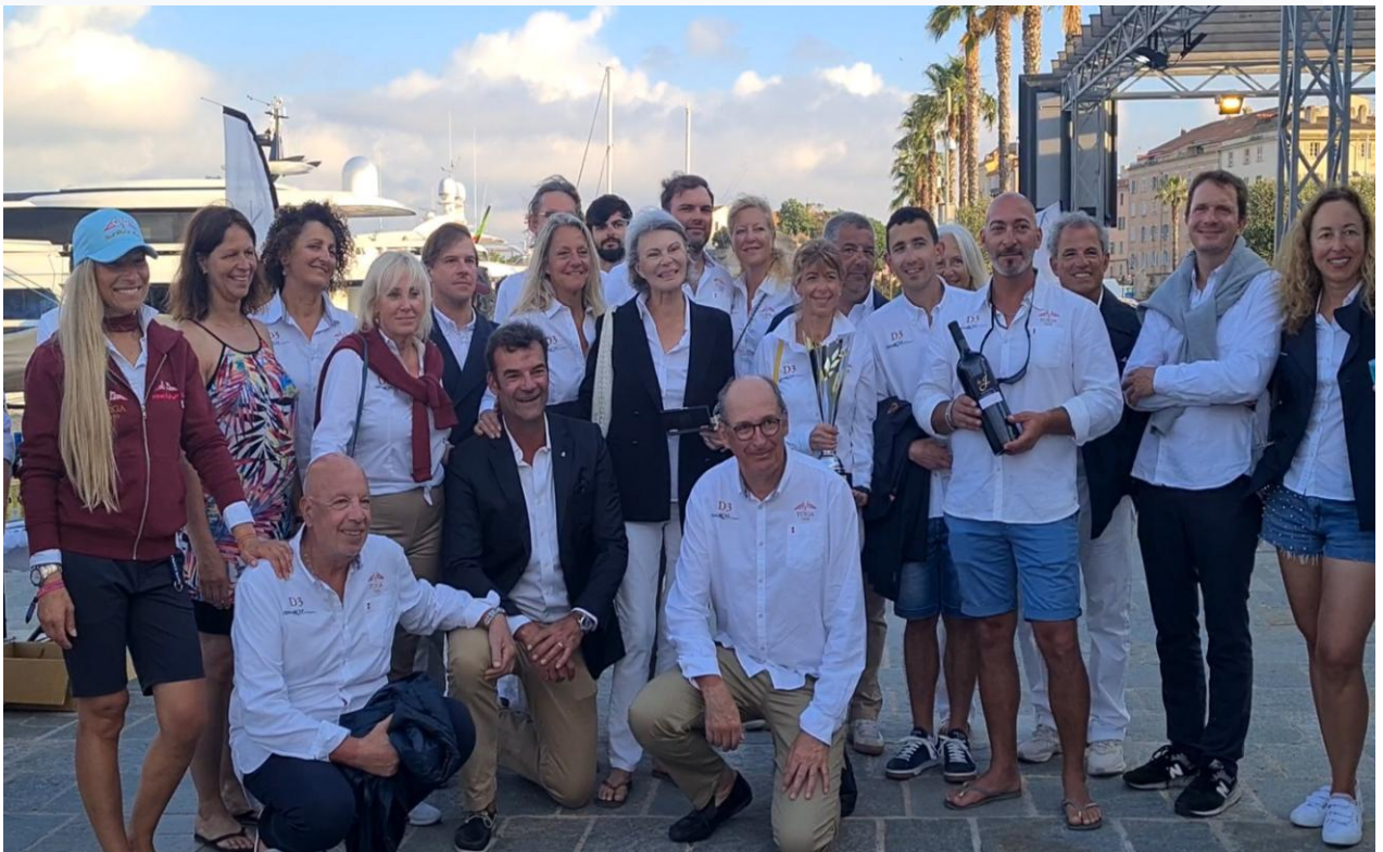
Régates Napoléon 2022 SY Tuiga x Yacht Club de Monaco Ajaccio Port Tino Rossi