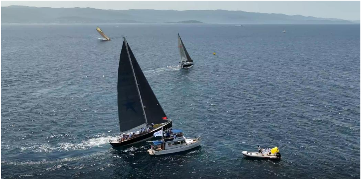
Régates Napoléon 2022 ligne de départ plage de Trottel

5 jours de régates dans le Golfe d'Ajaccio, avec une flotte amarrée dans l'enceinte du port Tino Rossi et des animations à terre, expositions, spectacles, conférences.