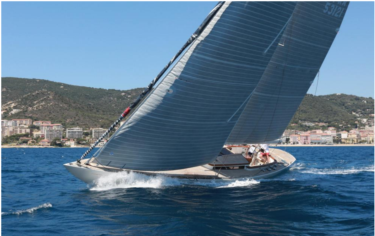
Régates Napoléon 2020 SY Quatre Quarts III Eagle 54