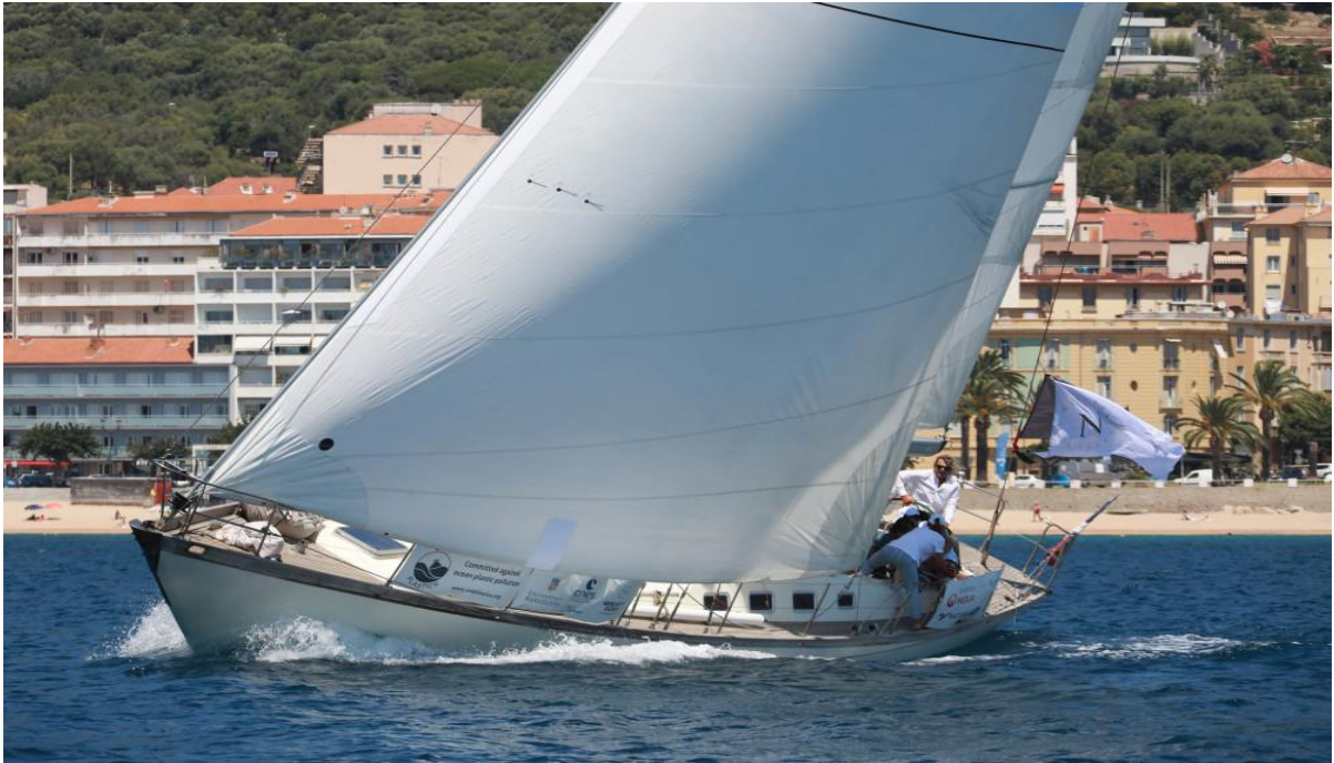
Régates Napoléon 2020 SY Dune Classique