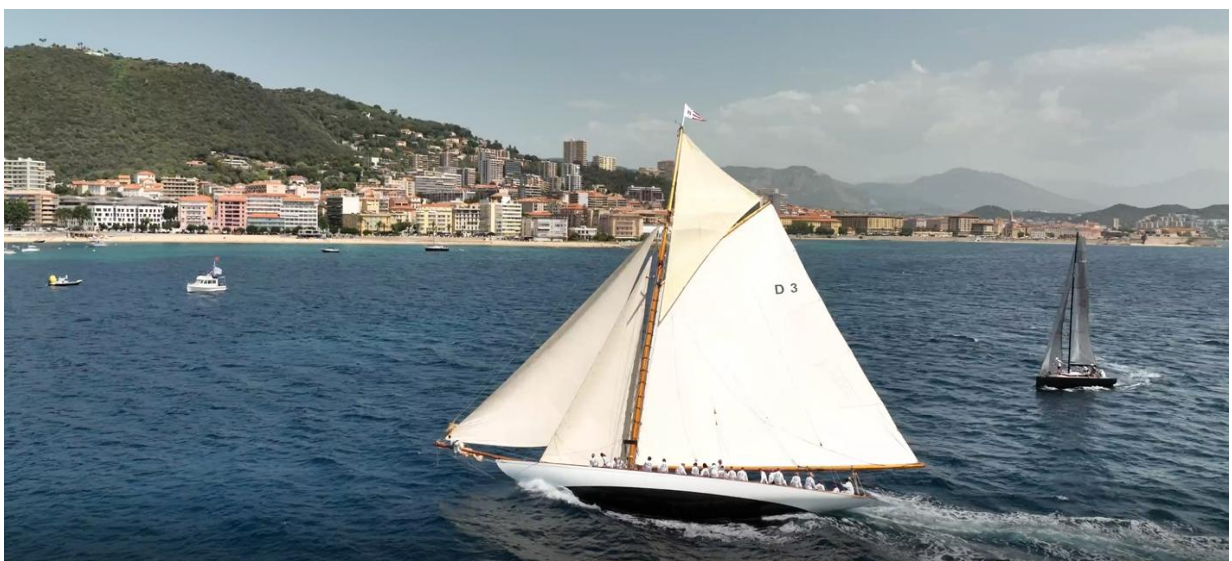
Régates Napoléon 2022 SY Tuiga

Réunir des passionnés de yachting, de la Corse, sur un stade nautique 5 étoiles à une période de l'année où le vent thermique souffle à plein régime pour profiter du soleil de printemps et des longues soirées de mai au cœur de la ville impériale.