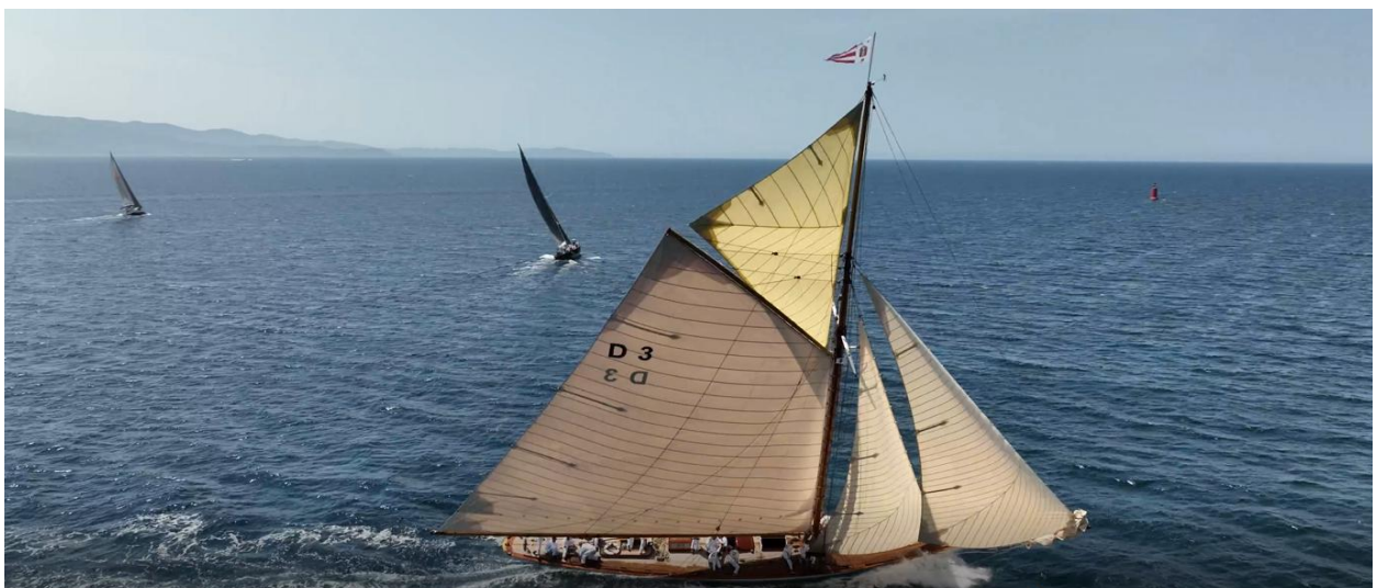
Régates Napoléon 2022 SY Tuiga

19h – 21h Remise des prix Chambre de Commerce de la Corse, cocktail, dîner de gala Port Tino Rossi.