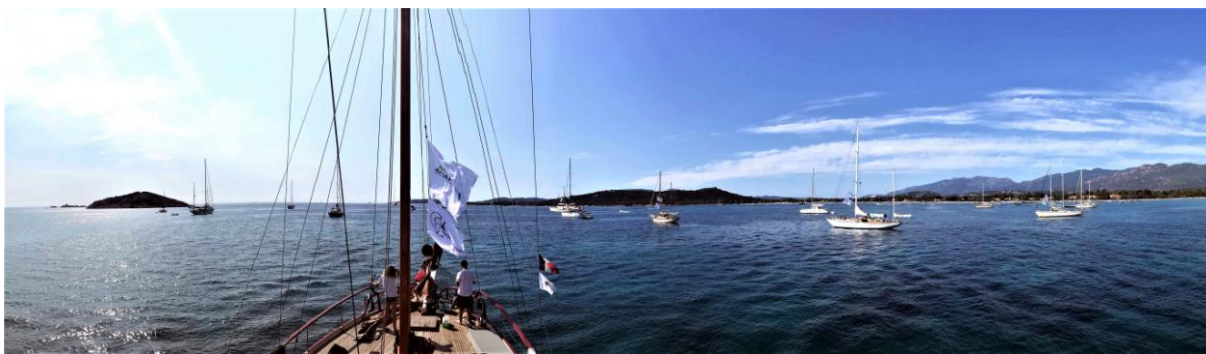
Saint Cyprien Corsica Classic 2018 flotte au mouillage