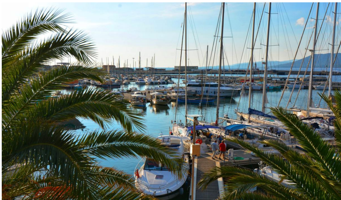
Port de Propriano