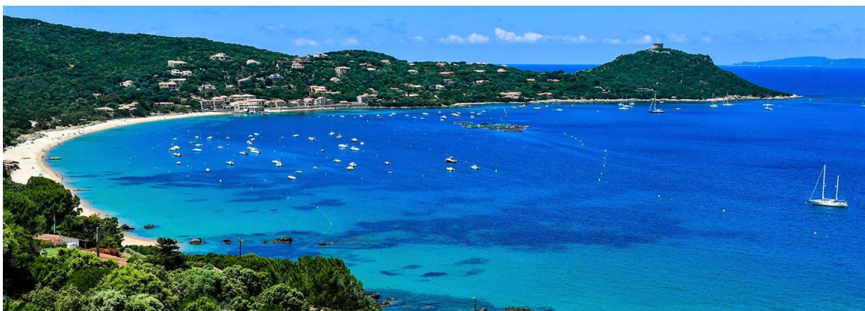
Golfe de Campo Moro