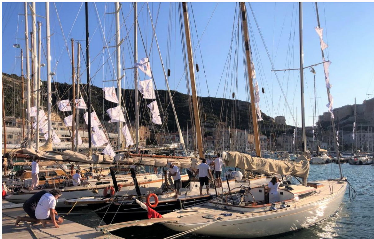
Bonifacio Marina Corsica Classic 2021

Boats may be required to display advertising chosen and provided by the organizing authority. If this rule is violated, the World Sailing Regulations 20.9.2 Applies.