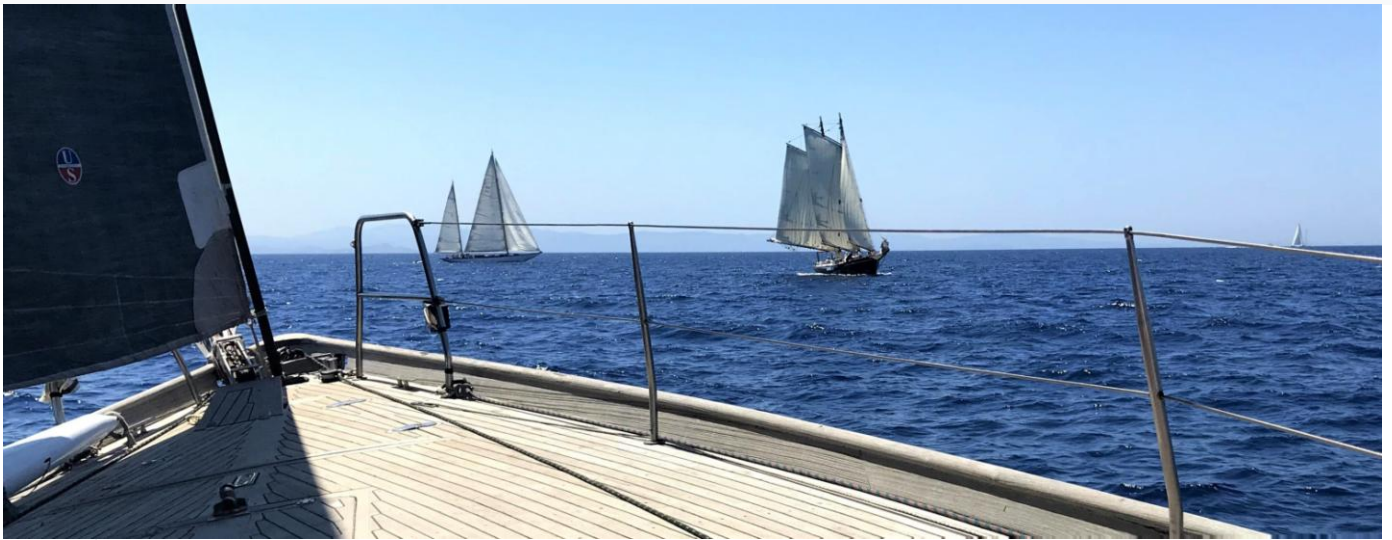
Régates d'Hippocrate 2021 ligne de départ

Late requests may be accepted, but a berth cannot be guaranteed. The final registration of each sailboat is left to the discretion of the Organizing Authority.