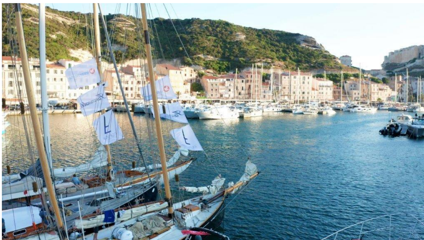
Régates d'Hippocrate 2021 Bonifacio

IRC Gauged must send their 2022 Gauge certificate to the AO at least 10 days before the start of the events.