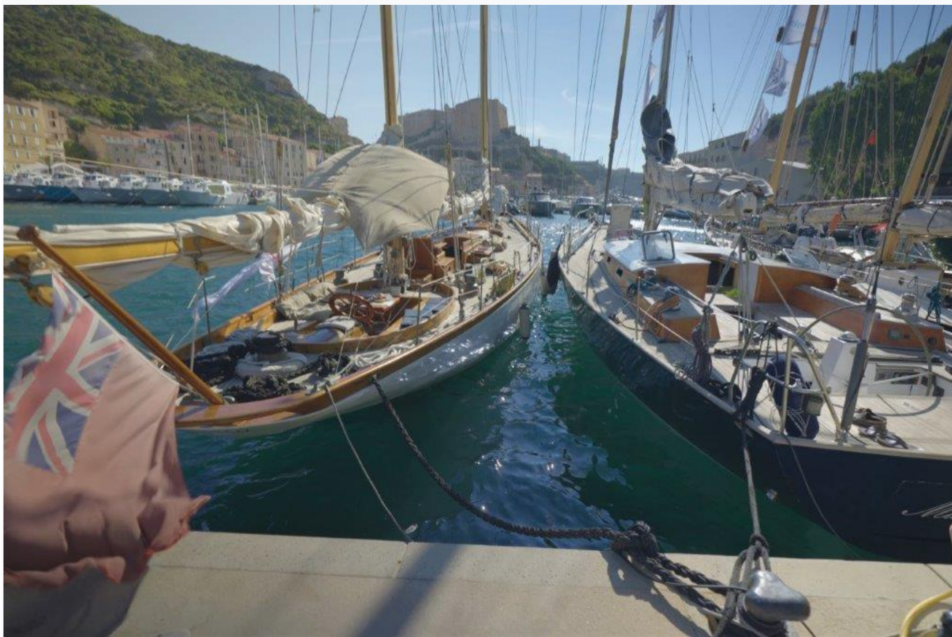
Régates d'Hippocrate 2021 ligne de départ

According to the C.I.M. and IRC 2021 – 2024 rules. These categories can be further divided into classes of 5 boats minimum according to the type of rigging and because of the hull length.