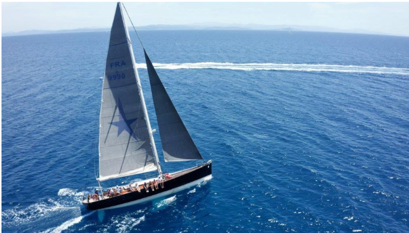
Régates d'Hippocrate 2021 SY Mister Fips

The regattas will be governed by the sailing racing rules 2021/2024, the notice of race, the sailing instructions, the class rules if applicable and the appendices. In case of translation of NOR, the French text will prevail. National prescriptions translated into English for non-French speaking foreign competitors [in appendix prescriptions]