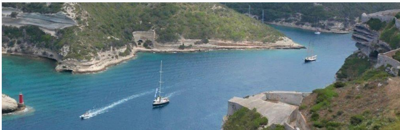
Régates d'Hippocrate 2021 Bonifacio

To benefit from free port berthing, a boat registered for the Hippocrate Regattas must obligatorily run at least three out of five regattas. The berths will be available to registered Yachts from Friday July 1, 2022 and must be vacated on Thursday July 7, 2022 at 11:00 am. It is recalled that neither the responsibility of the organizer nor of the port authorities can be engaged in the event of damage to the port or defective mooring.