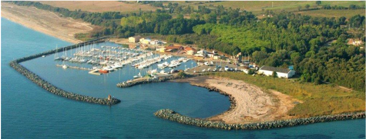
Port de Taverna costa verde

Situé sur la partie orientale de l'île, à Santa Maria Poghju, le port de Taverna est une escale idéale, abrité des vents d'ouest. Il est le seul entre Bastia et Solenzara, dispose d'une capacité de 450 places et il est équipé d'une drague pouvant accueillir des bateaux d'une longueur maximum de 25 mètres, de plus il propose 45 anneaux pour les bateaux de passage.