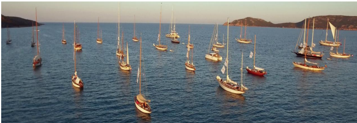
Bonifacio plage de Balistra

Io Donna (Italie), Harper's Bazaar Romania, Elle Man Romania, Vanityfair.fr , How To Spend It- Financial Times, GQ Spain, TF1 (JT de 13H), France 2 (Télématin), France 3 Via Stella (Corse), France 5 (Echappées Belles), M6 (Sport 6 et JT 19H45), Les Echos-Série Limitée, Air France Magazine, L'Officiel Yachting, Hôtel & Lodge, Rose Magazine, Mariefrance.fr , Challenges.fr , Upstyletravel.com , Woodenboat.com , Classicdriver.com , Corse Matin, D8 (Direct Auto), RTBF (Belgique), TV Paese (Corse), Le Point, L'Humanité Dimanche, Yachting Classique, Luxworldwide.com , Mytraveldreams.org , Ajaccio Magazine, Luxury Estate, Le Petit Bastiais, Dedicate Magazine, Men's Up.fr , sportsmarketing.fr , the luxe world.com , Le Figaro (Et Vous), Le Figaro Nautisme, Wad Mag, Bateau Vintage, Yachting Classique, Sailcouture.com , Auto Plus Mag, Sports Auto, Voile Magazine, Chasse-Marée, Tarpon Magazine (Russie), France Bleu RC FM, Aria Magazine (Air Corsica), Air France Madame, Paris sur La Corse, L'Exception, The Australian, lepoint.fr , Luxe Magazine, Live Style infotravel.fr , Lui Magazine, France Today. https://www.corsica-classic.com/Revue-de-presse_r14.html