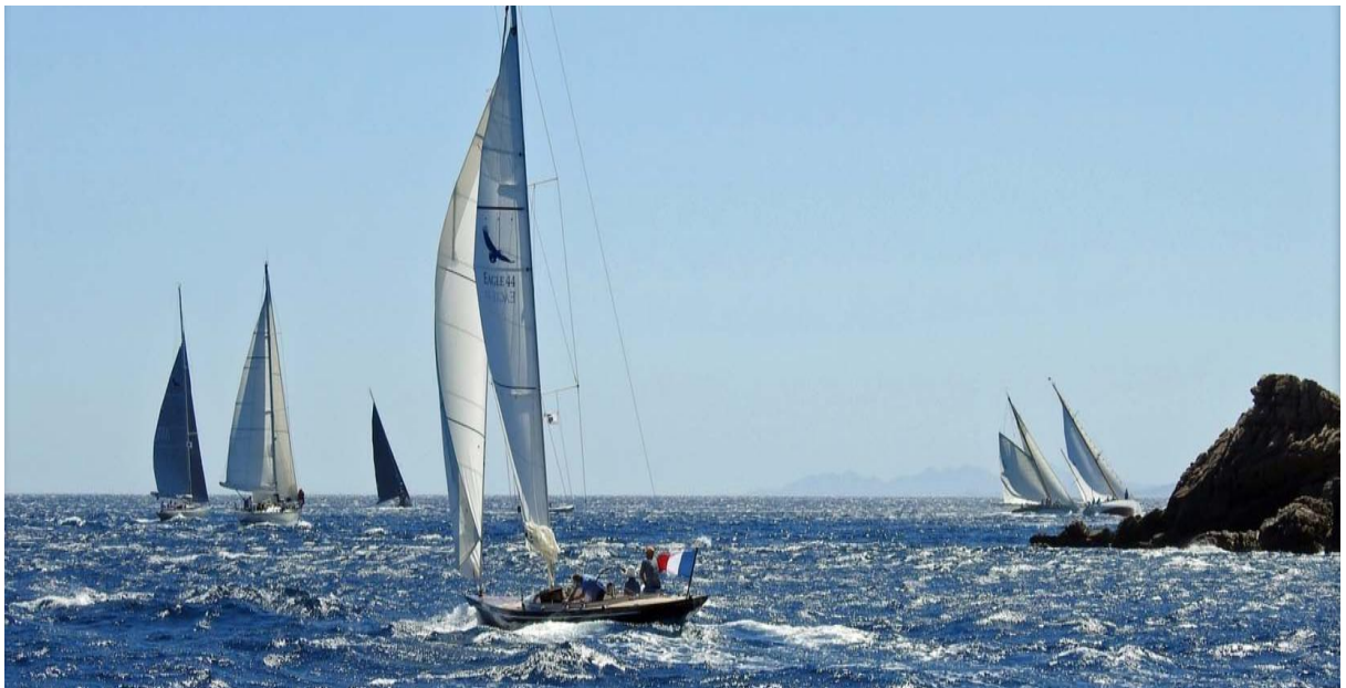
Bonifacio Golfe de Sant'Amanza CC 2020 SY Typhaine II

Bonifacio est la citadelle de l'extrême sud de la Corse, régissant sur un domaine maritime englobant les îles Lavezzi et Cerbicales et veillant sur ses fameuses « Bouches » qu'empruntèrent les Pisans, les Génois, les Aragonais, les turcs... tous ceux qui marquèrent son histoire toujours présente par ses monuments, trésors d'art et d'architecture, protégés par ses fortifications :