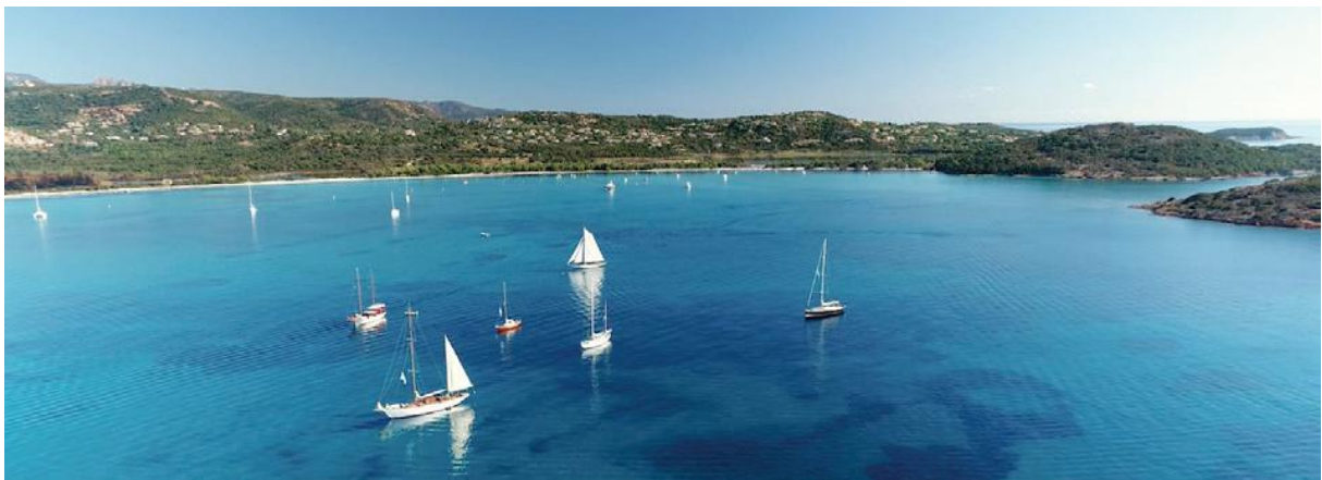
Saint-Cyprien Corsica Classic 2018 SY Vistona