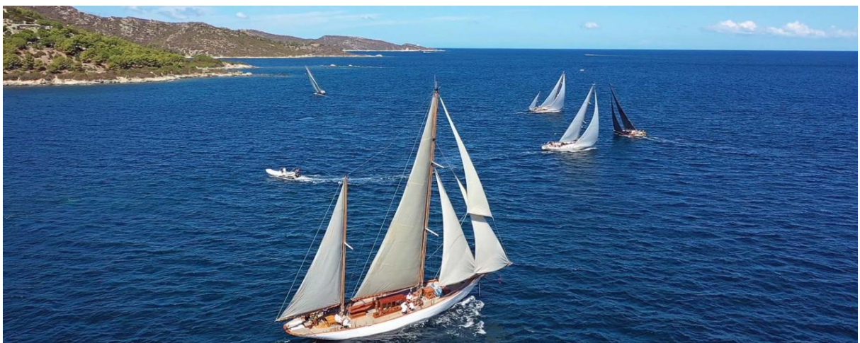
Saint-Florent ligne de départ CC 2020

Autrefois ville romaine, entourée de salines au Moyen-Âge, elle est aujourd'hui un charmant port de plaisance et de pêche à l'entrée des Agriates, à proximité des domaines de Patrimoine.