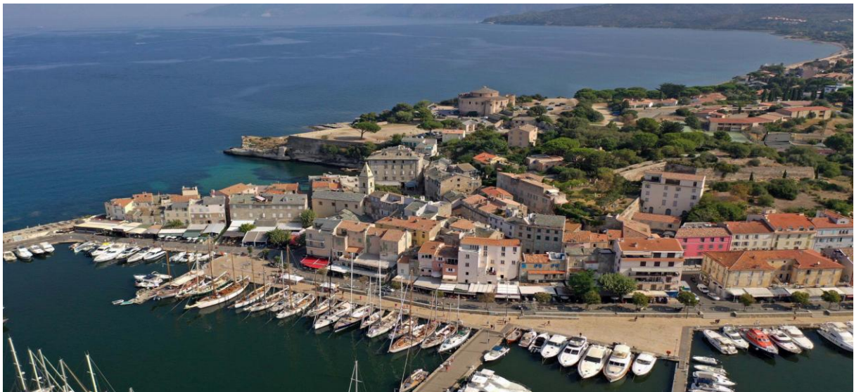
Saint-Florent CC 2019

San Fiorenzu, ancienne cité génoise nichée au fond du golfe, a été fondée vers 1440, au pied de la citadelle construite pour se protéger des aragonais, des français et des Ottomans.