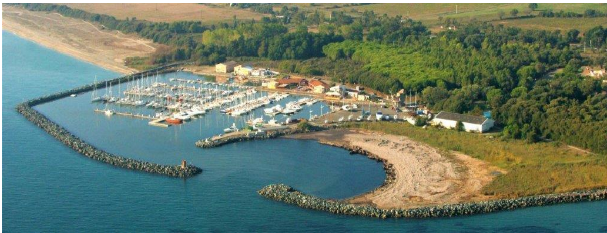
Port de Taverna costa verde

Situé sur la partie orientale de l'île, à Santa Maria Poghju, le port de Taverna est une escale idéale, abrité des vents d'ouest. Il est le seul entre Bastia et Solenzara, dispose d'une capacité de 450 places et il est équipé d'une drague pouvant accueillir des bateaux d'une longueur maximum de 25 mètres, de plus il propose 45 anneaux pour les bateaux de passage.