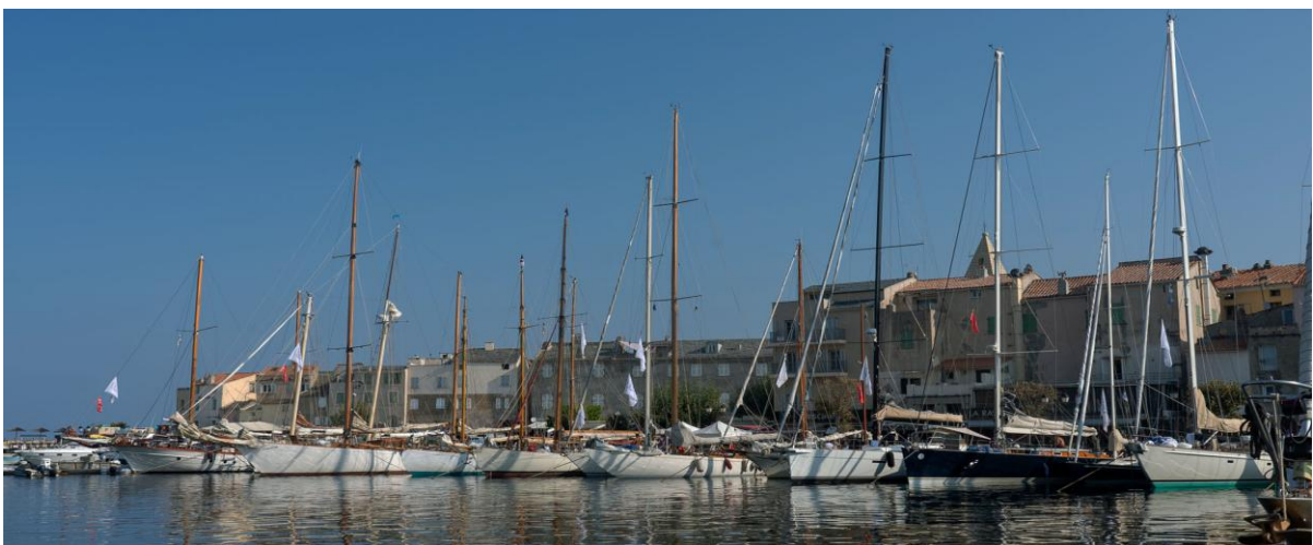
Port de Saint-Florent Corsica Classic 2019