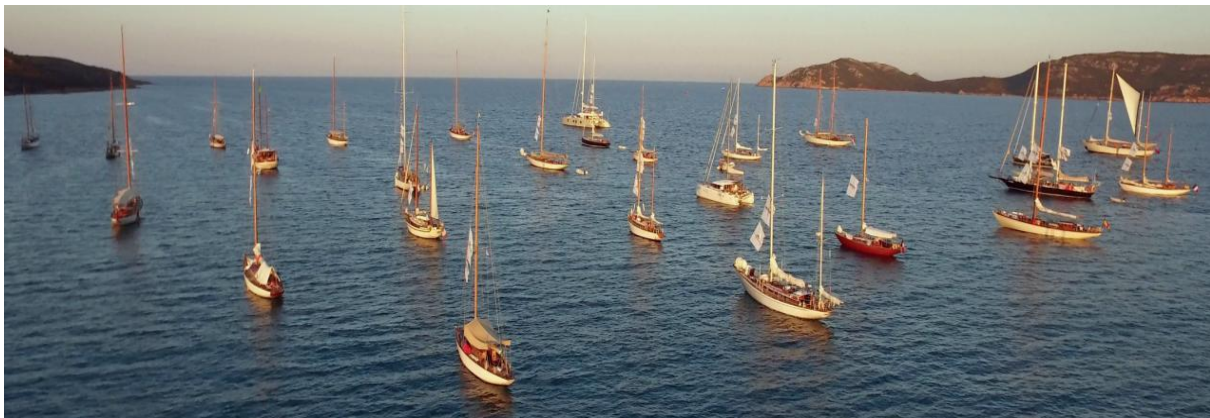
Bonifacio plage de Balistra

Io Donna (Italie), Harper's Bazaar Romania, Elle Man Romania, Vanityfair.fr , How To Spend It- Financial Times, GQ Spain, TF1 (JT de 13H), France 2 (Télématin), France 3 Via Stella (Corse), France 5 (Echappées Belles), M6 (Sport 6 et JT 19H45), Les Echos-Série Limitée, Air France Magazine, L'Officiel Yachting, Hôtel & Lodge, Rose Magazine, Mariefrance.fr , Challenges.fr , Upstyletravel.com , Woodenboat.com , Classicdriver.com , Corse Matin, D8 (Direct Auto), RTBF (Belgique), TV Paese (Corse), Le Point, L'Humanité Dimanche, Yachting Classique, Luxworldwide.com , Mytraveldreams.org , Ajaccio Magazine, Luxury Estate, Le Petit Bastiais, Dedicate Magazine, Men's Up.fr , sportsmarketing.fr , the luxe world.com , Le Figaro (Et Vous), Le Figaro Nautisme, Wad Mag, Bateau Vintage, Yachting Classique, Sailcouture.com , Auto Plus Mag, Sports Auto, Voile Magazine, Chasse-Marée, Tarpon Magazine (Russie), France Bleu RC FM, Aria Magazine (Air Corsica), Air France Madame, Paris sur La Corse, L'Exception, The Australian, lepoint.fr , Luxe Magazine, Live Style infotravel.fr , Lui Magazine, France Today. https://www.corsica-classic.com/Revue-de-presse_r14.html