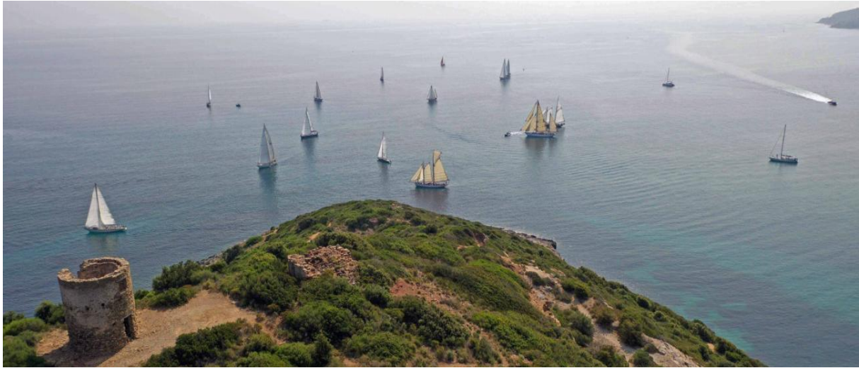
Macinaggio ligne de départ CC 2019