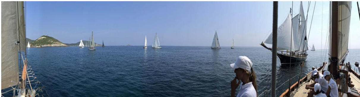
Macinaggio SY Hygie, SY Windjammer CC 2019

Déjà connue des Grecs, des Romains, des Sarrasins et des Génois, la baie de Macinaggio, était naturellement destinée à être un port. Macinaggio est la façade maritime de la commune de Rogliano.