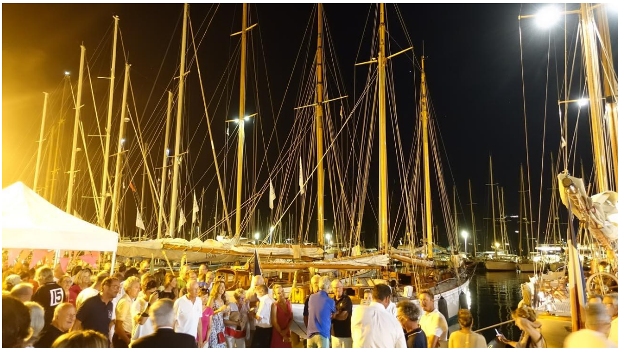
Port de Saint-Florent Corsica Classic 2019

Partenaires médias : Corse-Matin / RCFM France bleu Corse / France 3 Corse Via Stella.