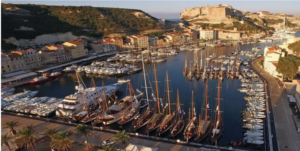
Port de Bonifacio

La Corse est reconnue pour sa nature exceptionnelle. Elle s'affirme comme une destination privilégiée pour de nombreux amoureux d'escapades marines grâce à ses 1 000 km de côtes au coeur de la Méditerranée. Ici, l'élégance et l'esthétisme sont à l'honneur, dans le plus grand respect des traditions du yachting classique. La Corsica Classic met à l'honneur la convivialité, avec des soirées, cocktails ou performances organisées à chaque escale, des moments de détente privilégiés pour les yachtmen.