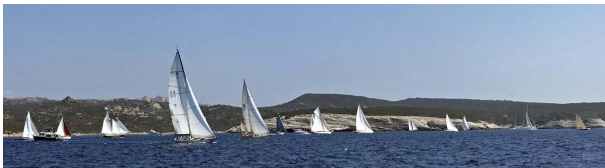
Bonifacio ligne de départ CC 2019

Les participants de la Corsica Classic prendront le départ de Bonifacio, où la flotte sera accueillie pour les inscriptions le mercredi 25 août, pour finir à Saint-Florent le mardi 31 août, après 5 escales et 170 milles nautiques.