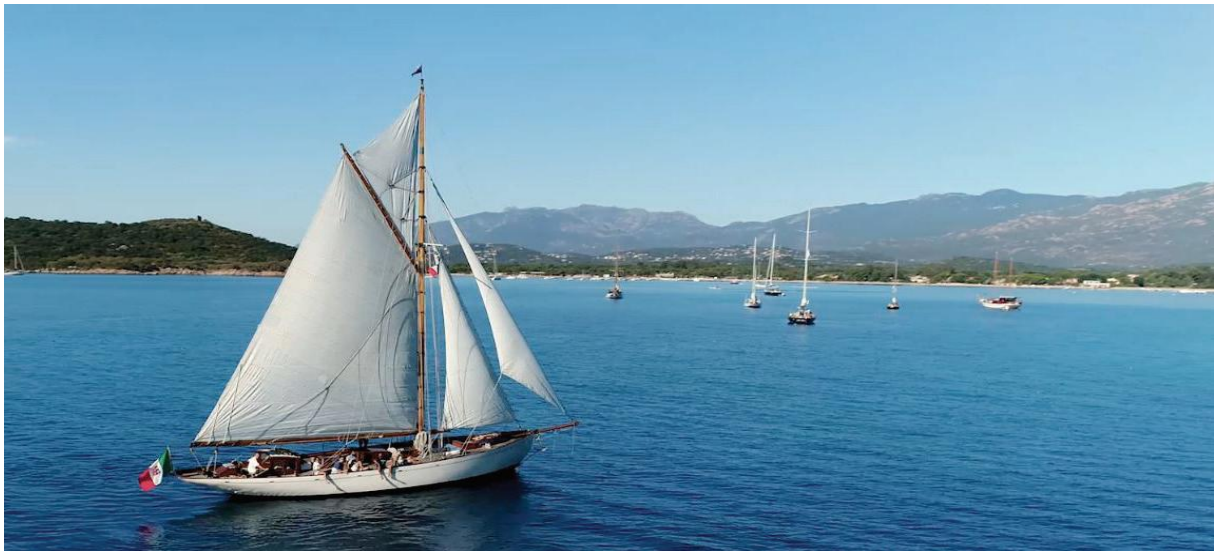
Saint-Cyprien Corsica Classic 2018 SY Vistona

Au nord de la plage, vers les eaux des étangs d'Arasu, sur les hauteurs, une tour génoise rappelle que sa voisine, Porto-Vecchio, est née au XVIe, lorsque la République de Gênes décida d'installer dans le golfe une nouvelle place forte.