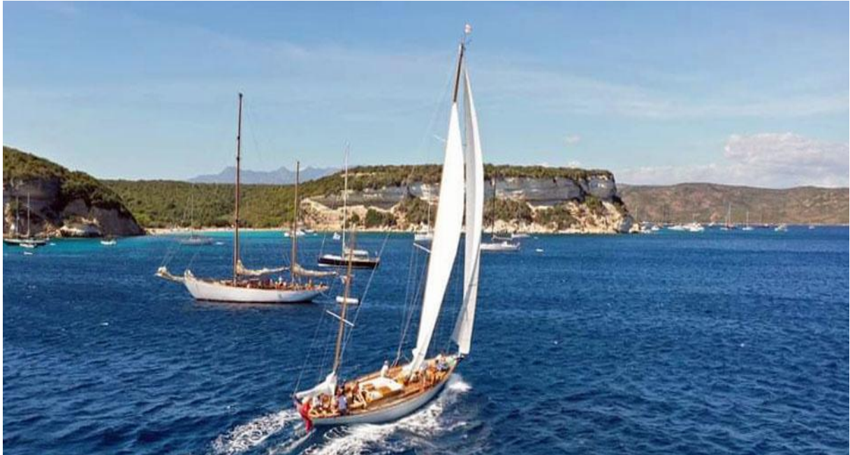
Bonifacio SY Skylark golfe de Sant' Amanza Hotel U Capu Biancu CC 2020

L'ouverture vers le grand public est un axe de développement, avec la possibilité de participer aux courses et d'affrètements de yachts en invités. La Corsica Classic incarne à travers cet événement unique, des valeurs positives qui sont au cœur des enjeux de nos partenaires, entre performances individuelles et cohésion d'équipe, entre tradition et anticipation, entre maîtrise technologique et respect de l'environnement.