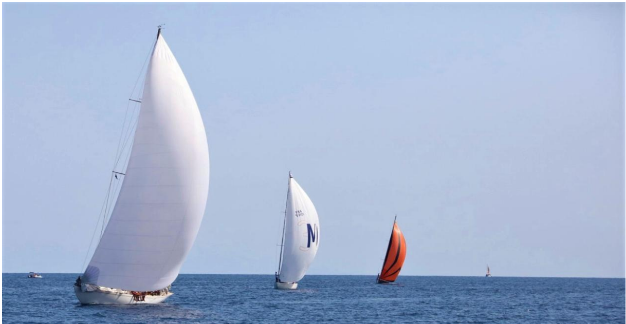
Taverna SY Eileen vs SY Quatre Quarts III Vs Hounbonne IV CC 2019

10h : briefing sur le quai Taverna 11h : départ du port 12h : départ Taverna - Macinaggio 19h : cocktail de bienvenue Macinaggio à bord