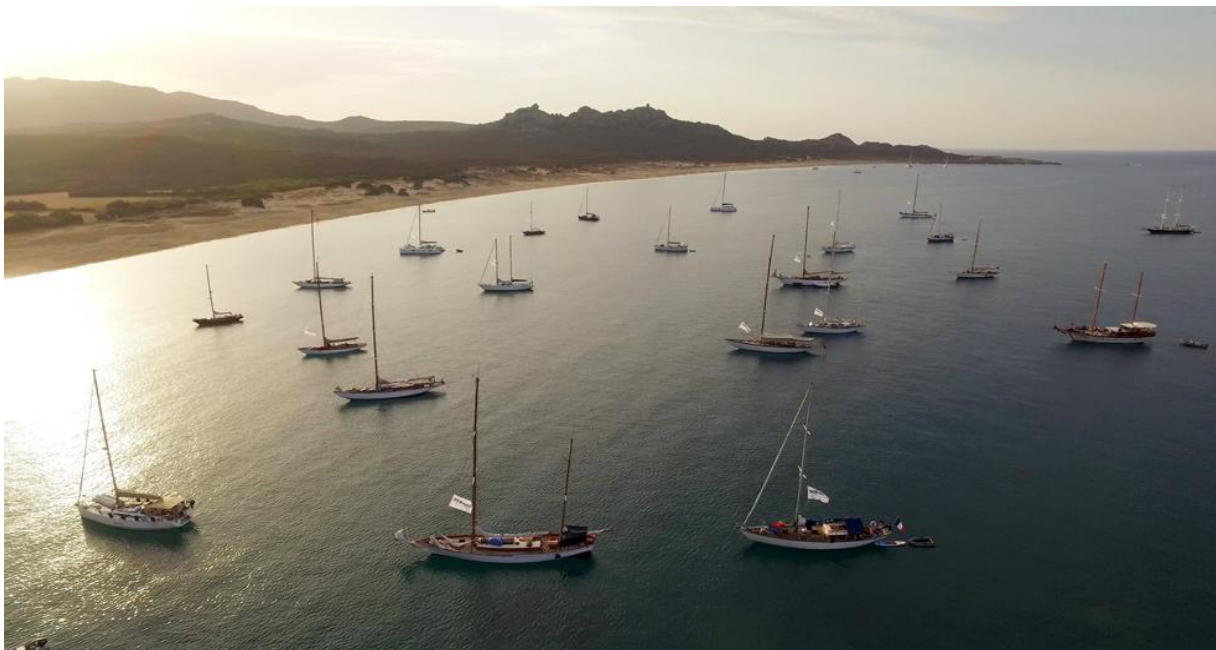
Plage d'Erbaju Domaine de Murtoli CC 2017 photo Emmanuel Krich DR

La Corse est reconnue pour sa nature exceptionnelle. Elle s'affirme comme une destination privilégiée pour de nombreux amoureux d'escapades marines grâce à ses 1 000 km de côtes au coeur de la Méditerranée. Ici, l'élégance et l'esthétisme sont à l'honneur, dans le plus grand respect des traditions du yachting classique. La Corsica Classic met à l'honneur la convivialité, avec des soirées, cocktails ou performances organisées à chaque escale, des moments de détente privilégiés pour les yachtmen.