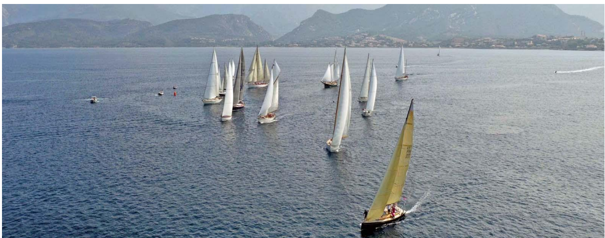
Saint-Florent, ligne de départ CC 2019