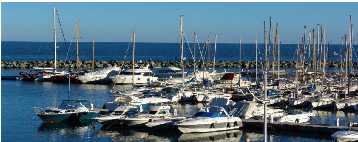
Port de Taverna costa verde

Cette régates qui fera escale dans notre région proposera aux participants de la course et à leurs familles toutes les commodités que peut offrir la Costa Verde. De nombreuses animations sont à découvrir lors de cette étape pour le plaisir de tous.