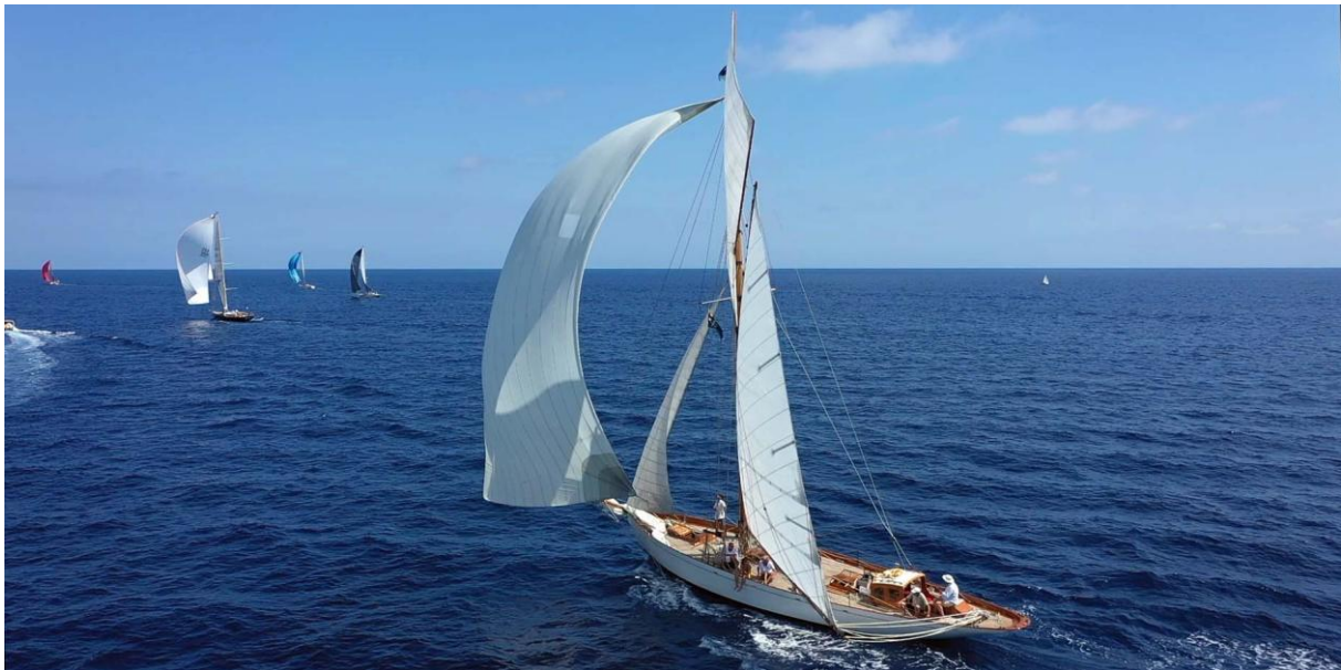
Porto-Vecchio - Sari-Solenzara SY Vistona CC 2020

19h : zone de mouillage baie de Saint-Cyprien service à bord du cocktail