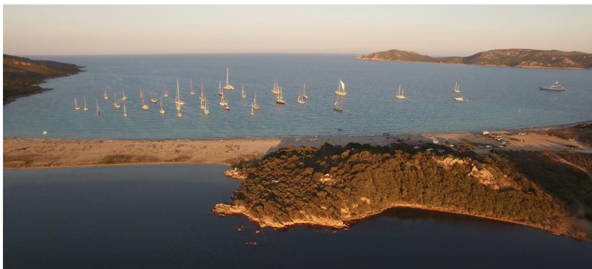
Bonifacio Golfe de Sant'Amanza CC 2017

La Corsica Classic 2021 sera le douzième Grand Cru de cette course côtière en étapes, organisée par l'association Corsica Classic Yachting, sous le patronage du Yacht Club de France. En une décennie, elle est devenue un événement sportif et lifestyle incontournable en Méditerranée.