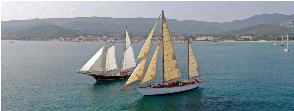
Macinaggio SY Hygie, SY Windjammer CC 2019

Ce village, accroché à flanc de montagne, affiche encore son faste de capitale historique du Cap Corse et résume l'histoire si caractéristique de ce territoire, cette terre ouverte sur la mer. Son église paroissiale, la seule, en Corse, à posséder une chapelle entièrement dédiée aux marins, regorge d'ex-voto. Napoléon Bonaparte, Pascal Paoli et l'Impératrice Eugénie comptent parmi ses hôtes illustres.