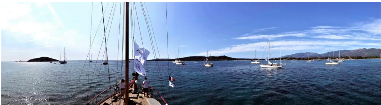
Saint-Cyprien CC 2016

19h : cocktail de bienvenue Costa Verde x Taverna assis