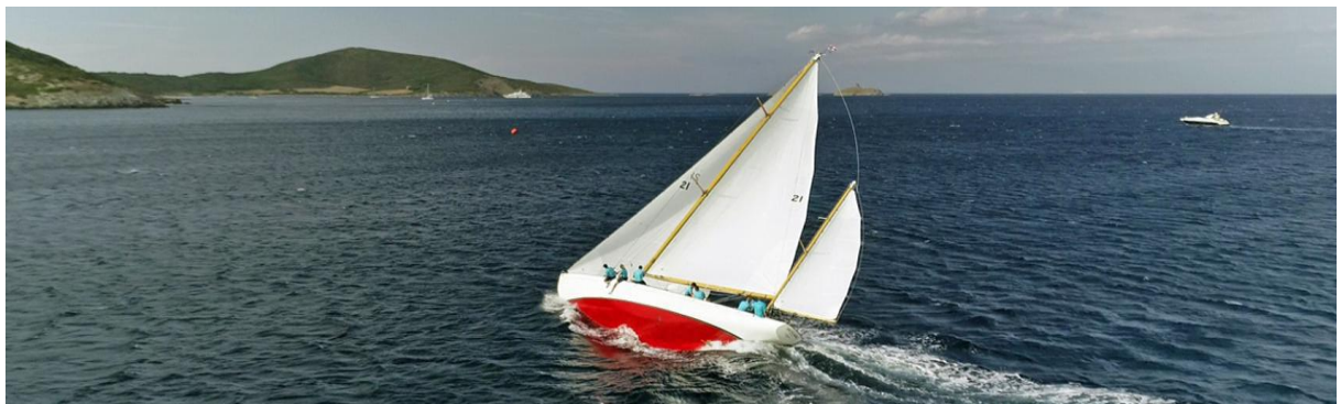
Macinaggio SY Skylark CC 2018

10h : briefing sur le quai de Macinaggio 11h : départ du port 12h : départ Macinaggio – Saint-Florent 19h : cocktail de bienvenue de Saint-Florent à bord