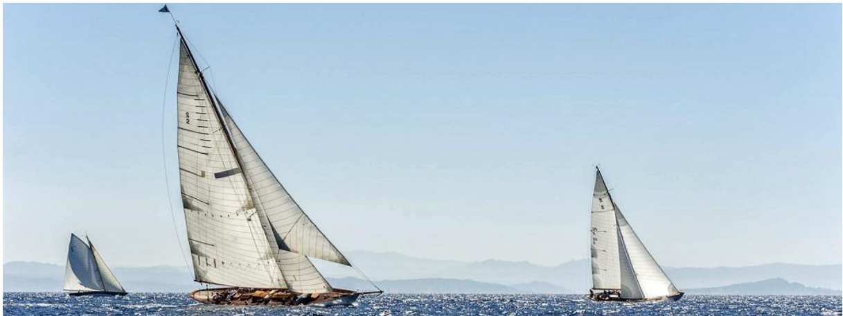
Bonifacio 2016 : SY Halloween, SY Serenade, SY Olympian

Mondialement connue pour ses falaises de craie au sommet desquelles se niche sa ville haute, Bonifacio domine un fjord impressionnant et un port naturel accueillant entièrement réhabilité.