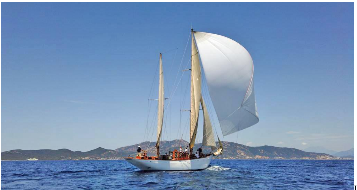
Regates Napoléon 2020 SY Hygie marque des Iles Sanguinaires

Corsica Classic Yachting Association : 10, rue Prosper Mérimée • 20 000 Ajaccio contact@corsica-classic.com www.corsica-classic.com