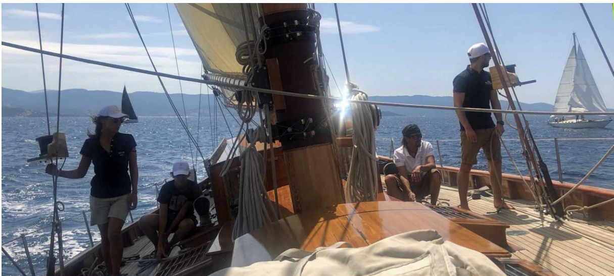
Régates Napoléon 2020 SY Hygie

Réunir des passionnés de yachting, de la Corse, sur un stade nautique 5 étoiles à une période de l'année où le vent thermique souffle à plein régime pour profiter du soleil de printemps et des longues soirées de mai au cœur de la ville impériale.