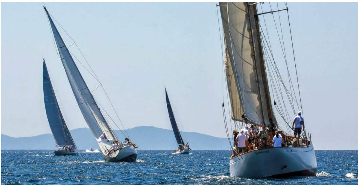
Régates Napoléon 2020 ligne de départ

Le golfe d'Ajaccio, véritable stade nautique : protégé des vents forts, assure une navigation idéale sous une brise de 10 à 20 nœuds.