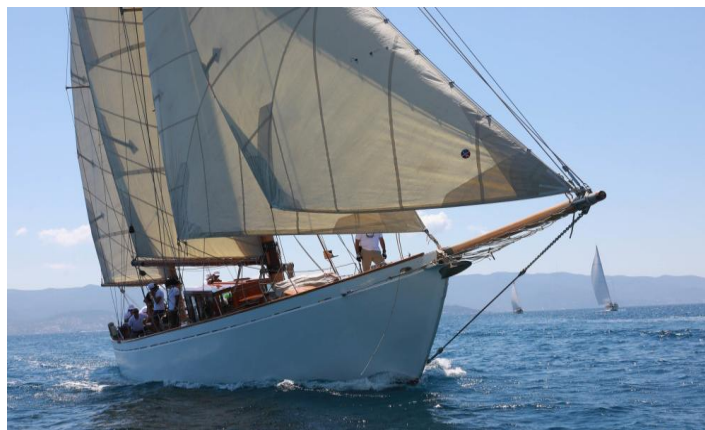
Régates Napoléon 2020 SY Hygie Epoque Marconi