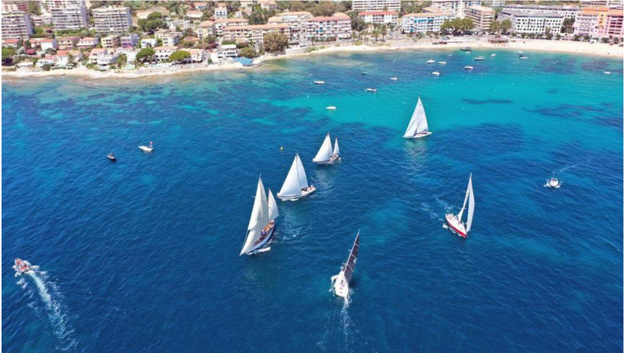
Régates Napoléon 2020 ligne de départ plage de Trottel

5 jours de régates dans le Golfe d'Ajaccio, avec une flotte amarrée dans l'enceinte du port Tino Rossi et des animations à terre, expositions, spectacles, conférences.