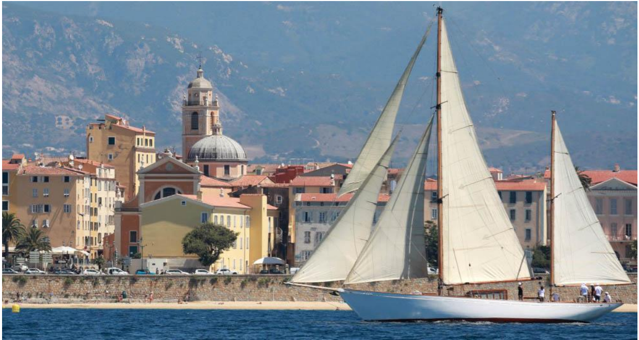
Régates Napoléon 2020 SY Hygie

La Corse est célèbre depuis toujours pour son exceptionnelle beauté et s'affirme comme une destination privilégiée pour de nombreux plaisanciers avec ses 1000 km de côtes au cœur de la Méditerranée.