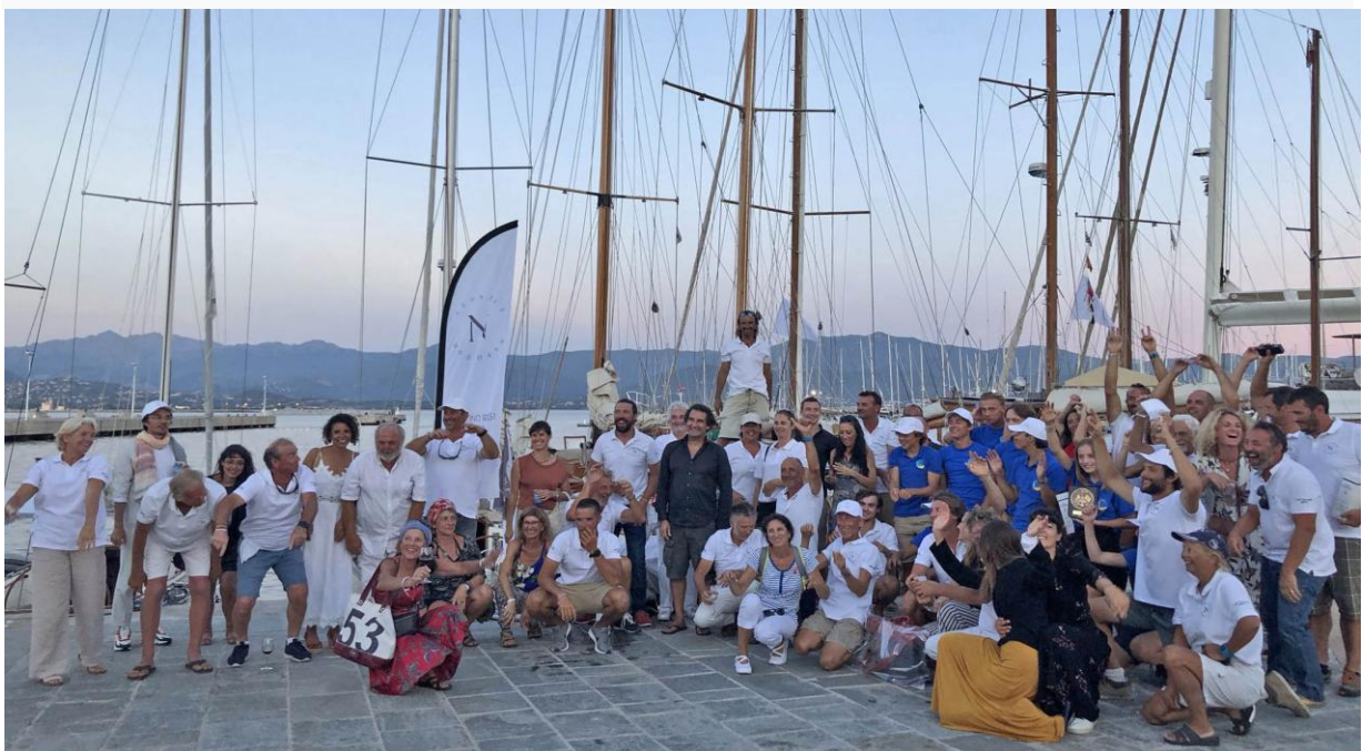
Régates Napoléon 2020 Ajaccio Port Tino Rossi