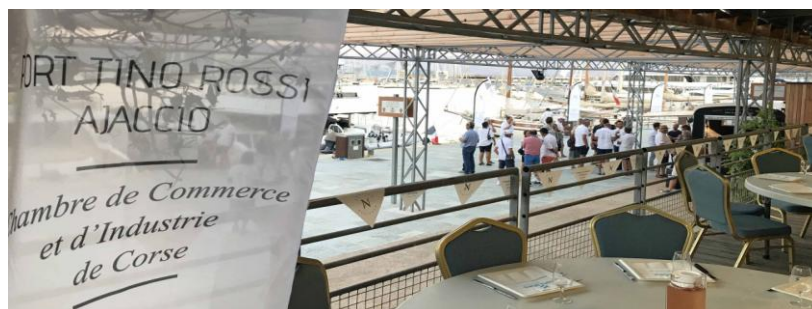
Régates Napoléon Port Tino Rossi palais des congrès

19h – 21h Remise des prix Chambre de Commerce de la Corse, cocktail, diner de gala Port Tino Rossi.