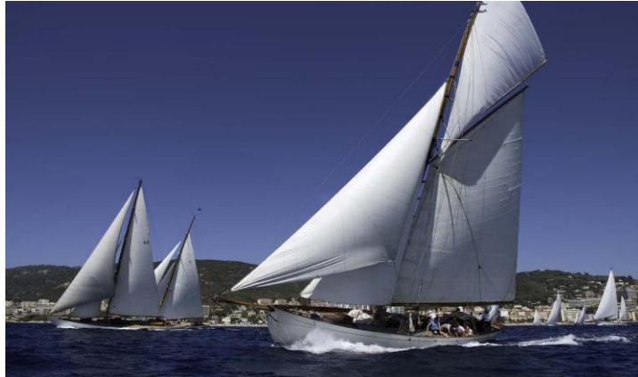
Corsica Classic 2017 Ajaccio, SY Vistona photo Nigel Pert DR Epoque Aurique