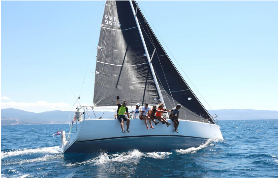
Régates Napoléon 2020 SY Aio Coco