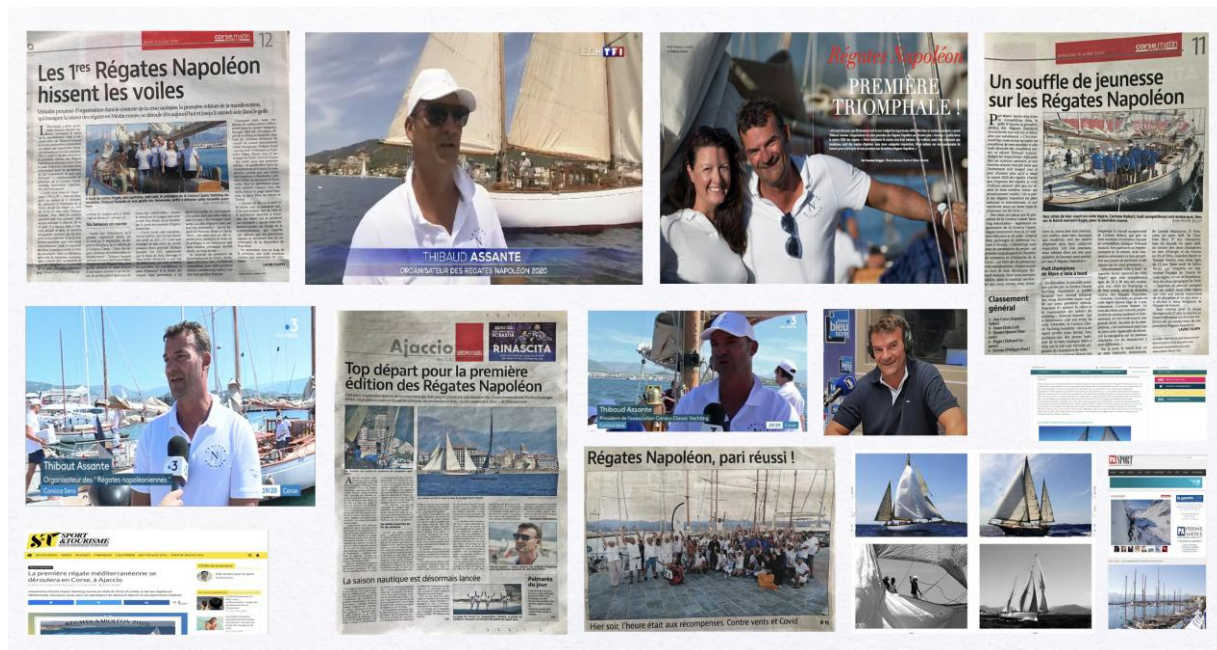
Régates Napoléon 2020 revue de presse

Les Régates Napoléon, première régates post COVID en Méditerranée en 2020 a servi d'exemple en termes d'accueil dans le respect des règles sanitaires. La passion a donné des ailes à l'organisation qui a décalé l'événement de fin mai à fin juillet. « On avait tous envie de se retrouver entre marins et de naviguer. La sortie yachting du confinement devait se faire en mer aussi et les Régates Napoléon ont donné le LA... Durant cinq jours une dizaine de voiliers classiques et modernes menés par 80 yachtmen ont pu apprécier le plan d'eau plat et son infatigable vent thermique qui nous a régales tous les jours... », commente Thibaud Assante. A terre, le port Tino Rossi et son palais des congrès s'était transformé en yacht club le temps d'une régates, avec son Beer truck Pietra, sa terrasse au dessus du quai et son restaurant rooftop réservé à l'organisation. Rendez-vous est pris du mardi 25 au dimanche 30 mai 2021 pour célébrer les 200 ans de la disparition de Napoléon Bonaparte dans sa ville natale, l'impériale Ajaccio.