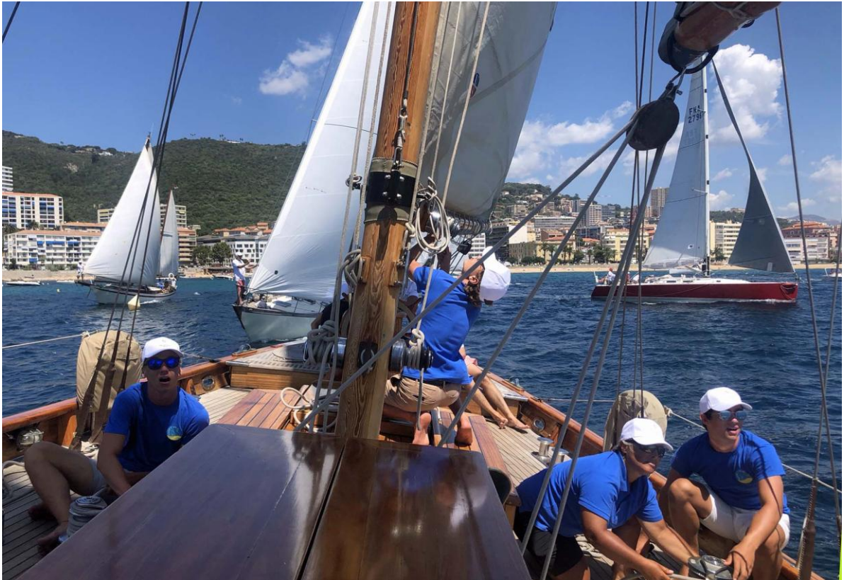
Regates Napoléon 2020 ligne de départ SY Hygie x Squadra Mare e Vela

Corsica Classic Yachting Association : 10, rue Prosper Mérimée • 20 000 Ajaccio contact@corsica-classic.com www.corsica-classic.com