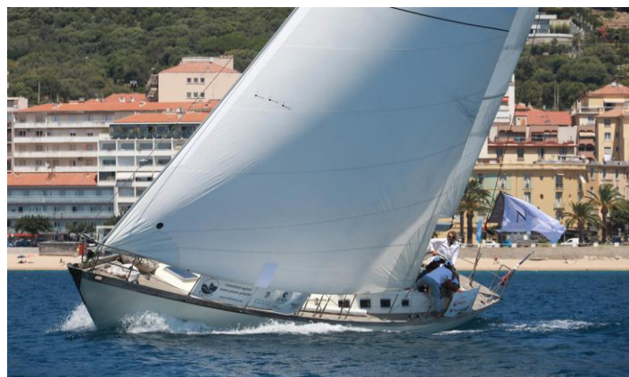
Régates Napoléon 2020 SY Dune Classique